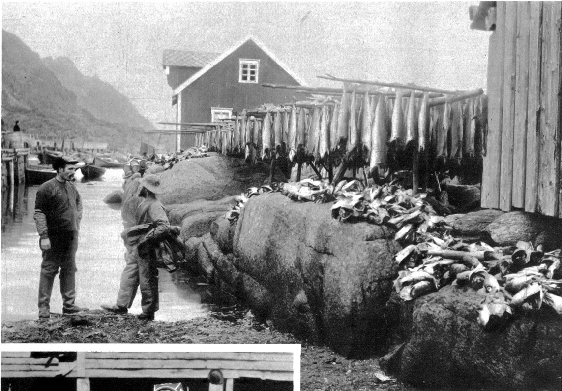
Die Fische werden an der Luft getrocknet (Loffoten-Inseln)