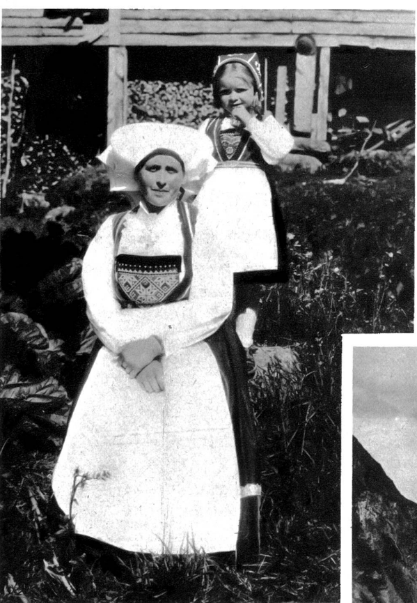
Tracht im Hardangerfjord

alltäglich verflärt. — Im Norden endlich, wo in Narvik die nördlichste Bahnlinie der Welt endet, das Wunder der Loffoten und Westeraalen, Lyngnesfjord und Nordkap, Ziele jeder Nordlandfahrt. Man vergißt nie wieder, wie sich die Landschaft an der Grenze der Arktis verwandelt. Manchmal an den veränderten Birken, die da wie struppige Delbäume wachsen, glaubt man in der Provence zu sein. — Der Wald aber, der gewaltige, frostherrschte Winterwald, ist noch lange wie das letzte Märchen der Natur, vor dem der grausame Entzauberer Mensch Halt machen mußte. — —