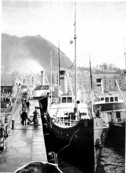
Im Hafen von Ålesund