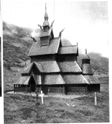
Stabkirche beim Sognefjord

die Titanenfront himmelragenden Gebirges, wo mit bobrenden Jungen der Degen Hunderte von Kilometern tief keine 2000 Meter freien Fjorde austrat, wo raufende Gletschbäche von blauen Gletschern und schneeweissen Firnen flürzten; wo die Nordlandblume aus der feuchten Luft ihre märchenhaften Schleier webt, wo grüne Matten, blumenüberfüllt, und herrliche Abteilungen Meer und Hochgebirge verbinden; wo im Schutze der vom Gletscherlauf umgebenen Schären Stadt und Fischerdorf arbeitfam sich reihen, von der Erhabenheit der Natur