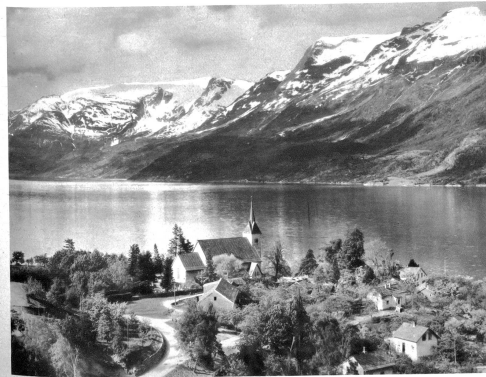
Dorf Ullensøng im Hardangerfjord

Norwegen! Das ist im Süden eine Folge fruchtbarer Niederungen und kultivierter Hochgebirgstäler, wo das frohe, in zufriedener Einfachheit und ehlicher Kraft selbstbewußte heimische Volkstum blüht, aus dem Jben und Hjörnin ihr Geistes schöpfen, Telemarken, das sportlich berühmte mit dem mächtigen Rjukanfoss-Wasserfall. — Im Osten die Tiefenlandschaft von Oslo und ein Hügelland von sonniger Heiterkeit, dem einseitigen Fremden Norwegens erheitert, freundlicher Gruß. — Schöne gelinde Fjorde, Flüsse, Seen, Hügelland, das nördlich vom bevölkerten Landesteil um die Hauptstadt zu mäßigen Berggruppen emporwächst, wo meistens feierliche Lammnieder die Einfachheit menschlicher Siedlungen trennen. — Im Westen