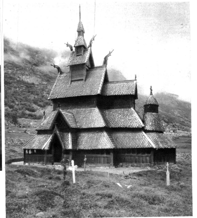
Stabkirche beim Sognefjord

die Titanenfront himmelragenden Gebirges, wo mit bobrenden Jungen der Degen Hunderte von Kilometern tief keine 2000 Meter freien Fjorde austrat, wo rauschende Gletschbäche von blauen Gletschern und schneeweißen Firnen flürzten; wo die Nordlandblume aus der feuchten Luft ihre märchenhaften Schleier webt, wo grüne Matten, blumenüberfüllt, und herrliche Abteilungen Meer und Hochgebirge verbinden; wo im Schutze der vom Gletscherlauf umgebenen Schären Stadt und Fischerdorf arbeitfam sich reihen, von der Erhabenheit der Natur