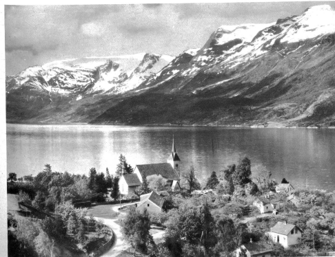
Dorf Ullensøng im Hardangerfjord

Norwegen! Das ist im Süden eine Folge fruchtbarer Niederungen und kultivierter Hochgebirgstäler, wo das stolze, in zufriedener Einfachheit und ehlicher Kraft selbstbewußte heimische Volkstum blüht, aus dem Nben und Hjörnin ihr Geistes schöpfen, Telemarken, das sportlich berühmte mit dem mächtigen Rjukanfoss-Wasserfall. — Im Osten die Tiefenlandschaft von Oslo und ein Hügelland von sonniger Heiterkeit, dem einseitigen Fremden Norwegens erheit, freundlicher Gruß. — Schöne gelinde Fjorde, Flüsse, Seen, Hügelland, das nördlich vom bevölkerten Landesteil um die Hauptstadt zu mäßigen Berggruppen emporwächst, wo meistens feierliche Lammnieder die Einfamkeit menschlicher Siedlungen trennen. — Im Westen