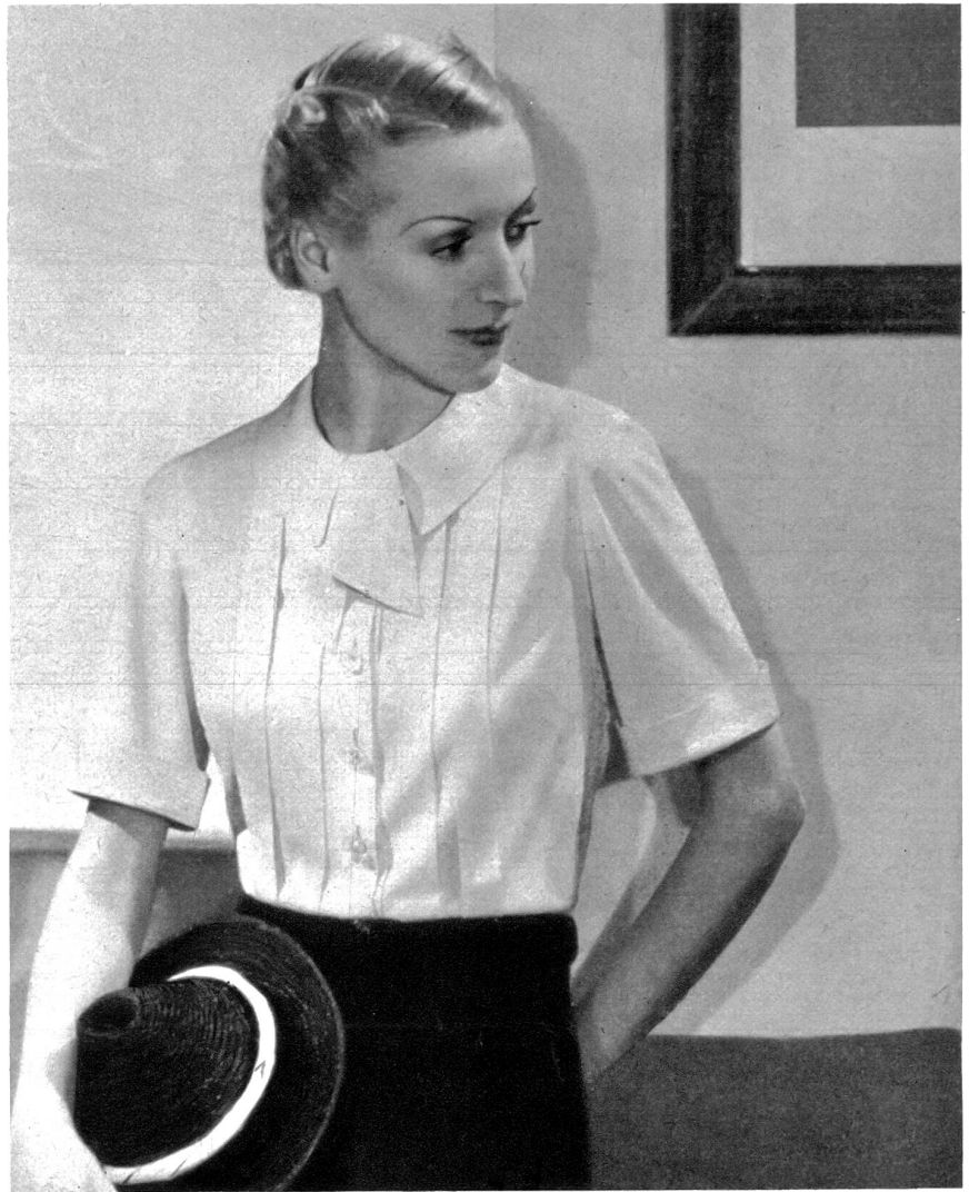
Nr. 1 Kleidsame Bluse aus weisser Waschseide; Stoffbedarf bei 0.80 cm Breite 2.20 m, bei 1 m Breite 1.70 m Zuschneiden und Heften Fr. 2.80

Die Rücksendung erfolgt prompt unter Nachnahme für das Zuschneiden.