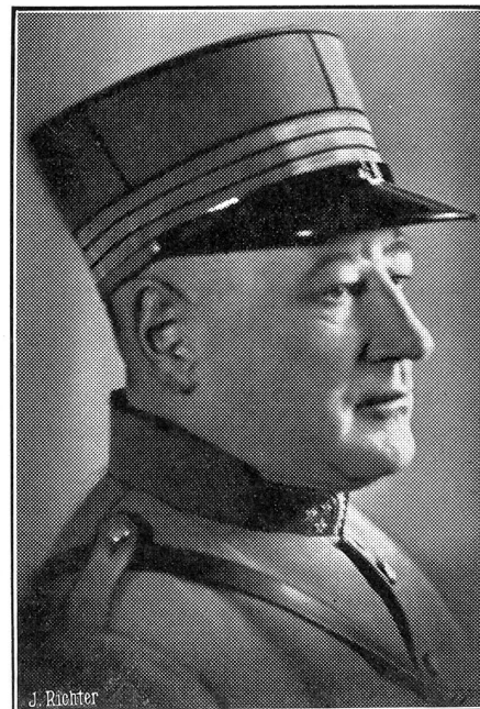
Die Landesverteidigungskommission hat dem Bundesrat seine Neuwahlen für die Besetzung der Kommandostellen der Heeresseinheiten neuer Truppenordnungen auf 31. Dezember 1937 vor- geschlagen. Letzterer hat diesen Beschlüssen zugestimmt. — Zum Kommandanten der 3. Division wurde gewählt: Oberst von Graffen- ried, zurzeit Kdt. Gerb.-I.-Br. 5.

Wie Bundesrat Minger in einer An- sprache an die Unteroffiziere, am Schwei- zerischen Unteroffizierstag in Luzern mit-