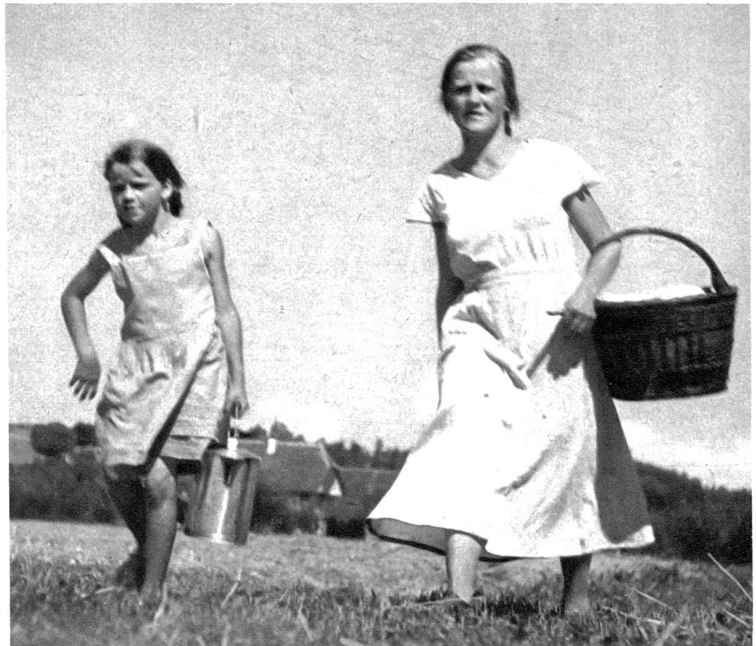
Ständig sind sie unterwegs. Bald hier, bald dorthin bringt die Bauernmagd und das Töchterchen „z'Zimis“ (z'Vieri) auf das Feld hinaus