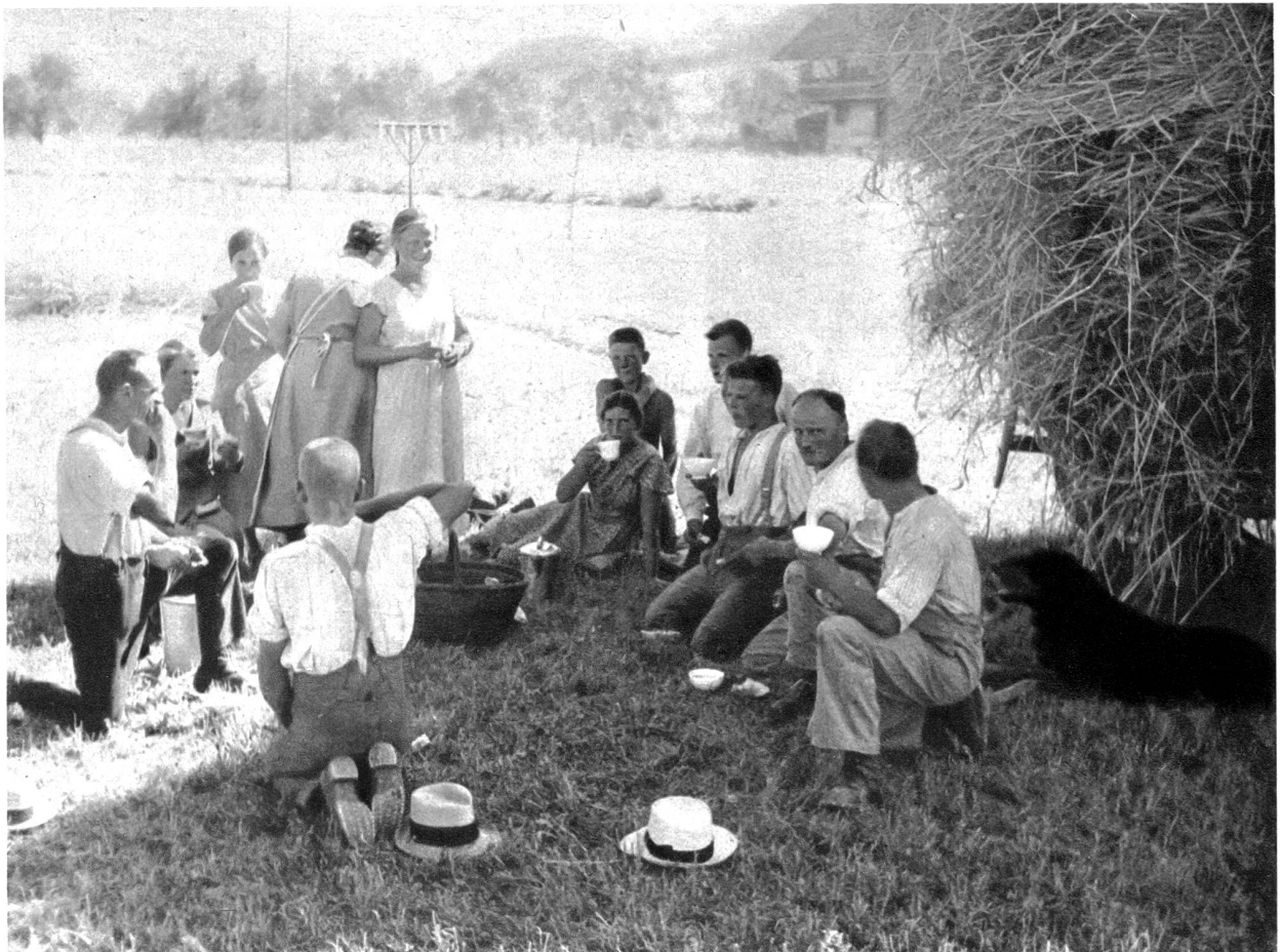
Im Schatten des grossen Getreidefuders wird z'Vieri genommen.