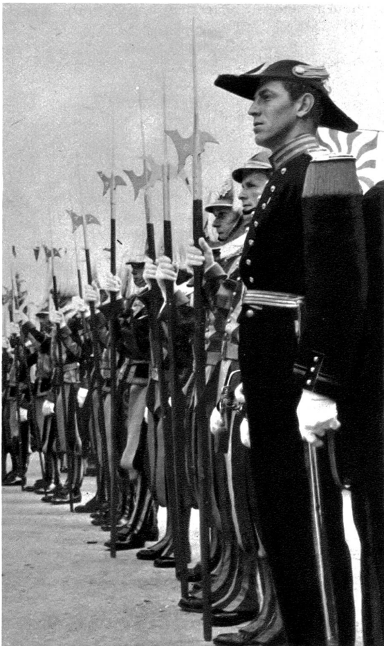
Päpstliche Gardisten im Festzug