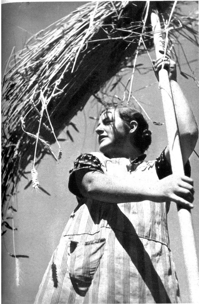
Auch die Magd hilft tüchtig mit