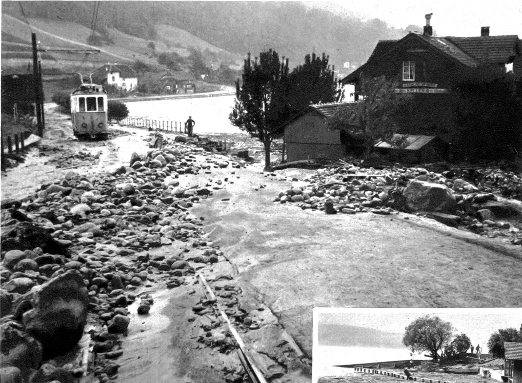
Ueberschwemmte Staatsstrasse Oberhofen