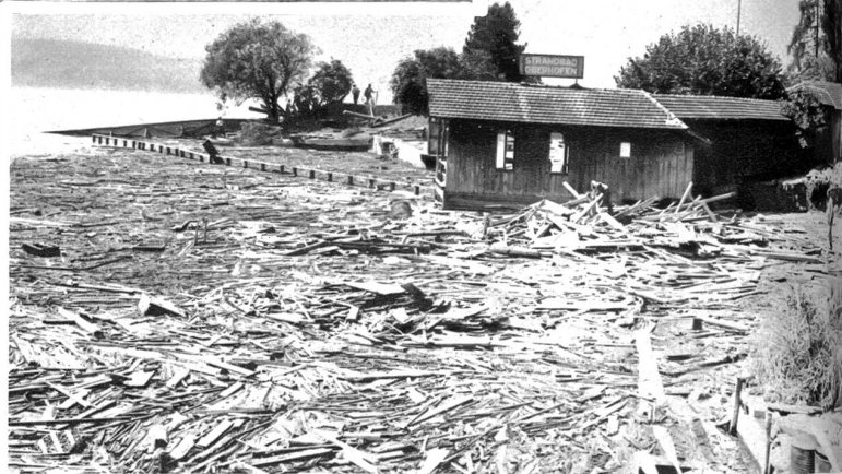
Beim verschlammten Strandbad ist der See gefüllt mit Material aus der Harmoniumfabrik Keller, Oberhofen.