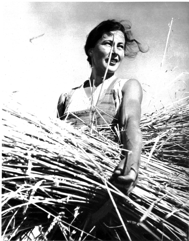
Die Garbe wird zusammengebunden