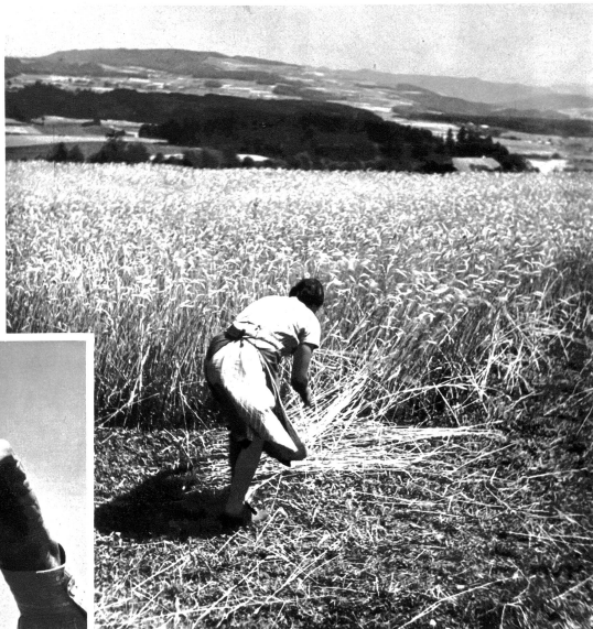
Wiederum rauschen auf dem Lande draussen die reifen Ährenfelder