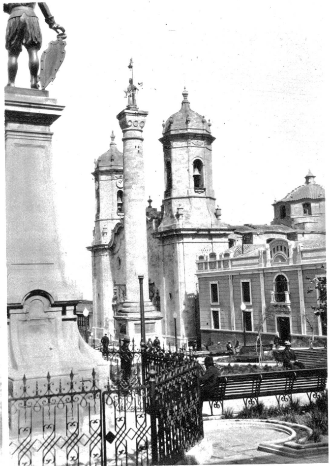
Die Plaza rode Novembre mit dem Denkmal Alfonso de Iñancz, der Freiheitsstatue und der Kathedrale in Potosi

Der Markt in Potosi ist die Straße. Selten findet man die gleiche Fremdartigkeit, die gleiche Farbenfreudigkeit und soviel anmutige Marktfrauen. Die Cholas, Indianermischlinge, mit hellgelben Strohhüten und bunten Seidentüchern, die Indianerinnen mit ihren purpurroten Leberwürfen zu orangenen Röcken, die Indios mit ihren buntgemusterten Ponchos, geben dem Straßenbild eine ungemein reizvolle Note. Tomaten, Aji, herrliche tropische Früchte aus den Jungastälern, und an zweihundert verschiedene Kartoffelsorten — Bolivien ist das Geburtsland der Kartoffel — Schaffäße, selbstgefertigtes Tongeschirr und Schilfflöten werden feilgeboten. Zwischen die leuchtenden Far-