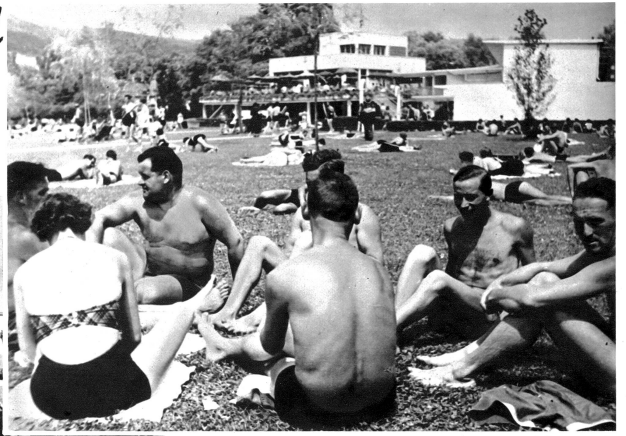
Im gemütlichen Freundeskreise lässt sich gut diskutieren