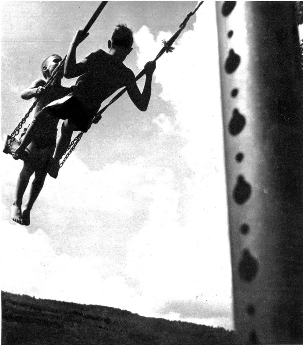
Im Badhöschen auf der Schaukel, o welche Lust für die Kinder