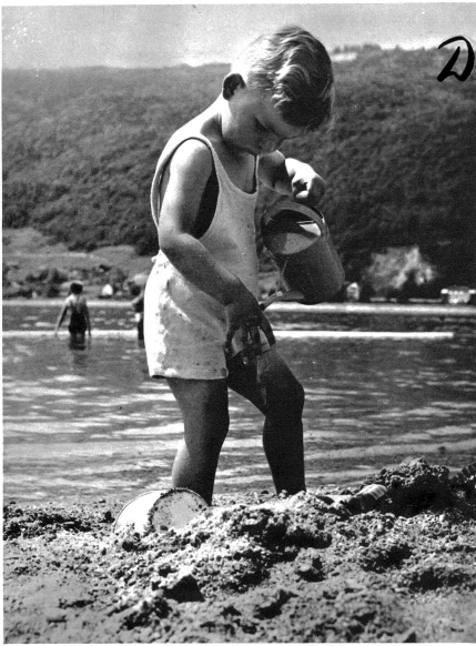
Der kleine Strandbaumeister nimmt die Sache ernst

Venedig hat seinen Lido, Biarritz seine ungeliebte Plage, Biel aber hat seit dem Jahr 1932 ein prächtiges Strandbad, von welchem hier einige Bilder wiedergegeben werden.