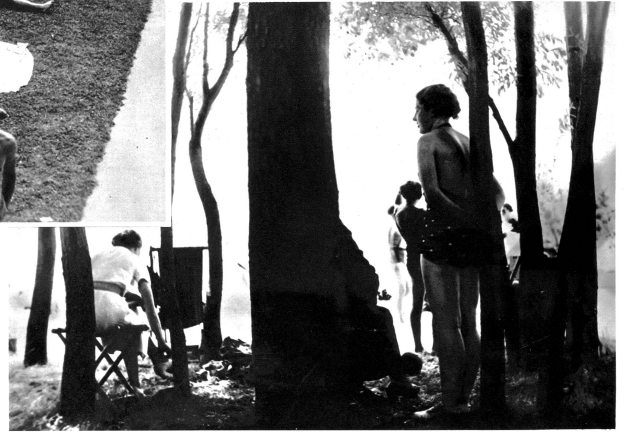
Welch lauschige Plätzchen dieses Strandbad aufweist!