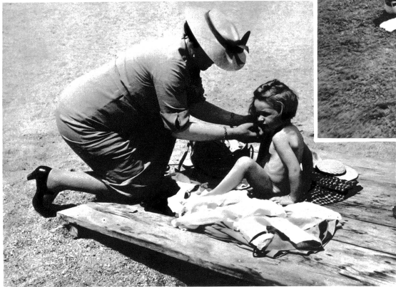
Sonntagsbetrieb: Licht, Luft und Wasser, wer möchte da die Sorgen auch vergessen!