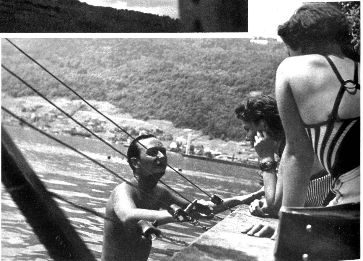
Ein kleiner Flirt mit so hübschen Strandnixen ist ganz selbst- verständlich