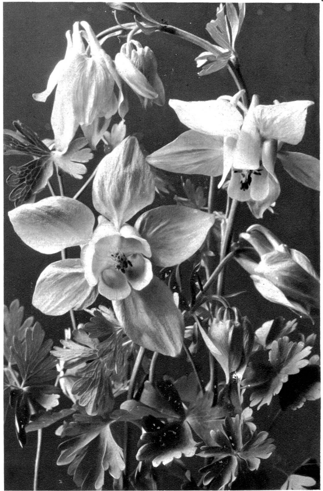
Alpenakelei. Aquilegia Alpina.