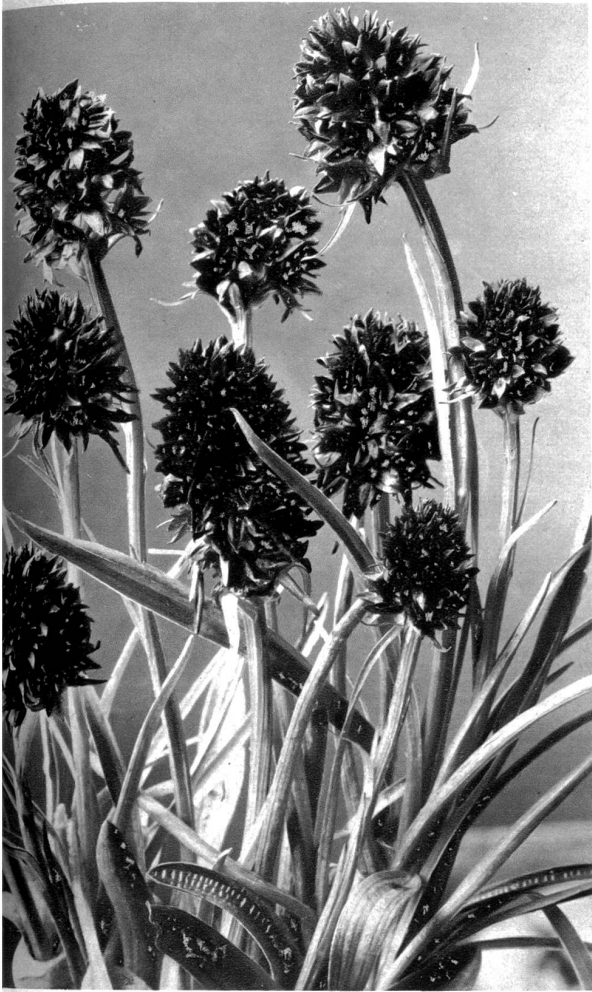
nerreu. Nigritella angustifolia.