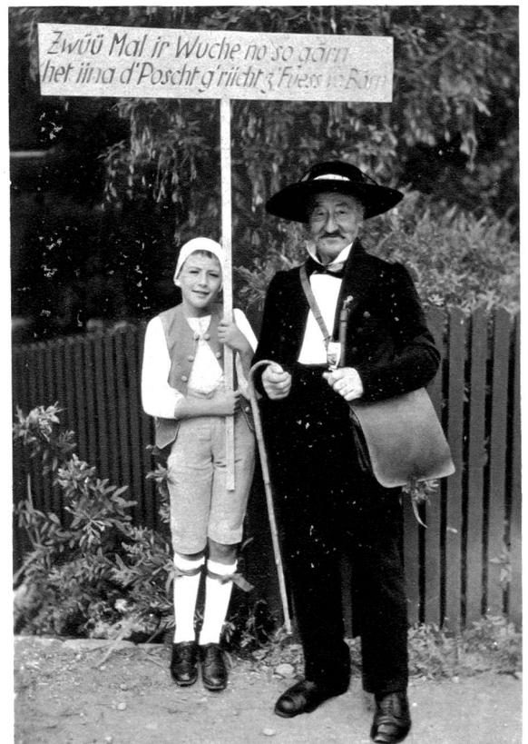
Zwü Mal ir Wuche no so gärn het ina d'Poscht g'rächt z' Fuess im Bann