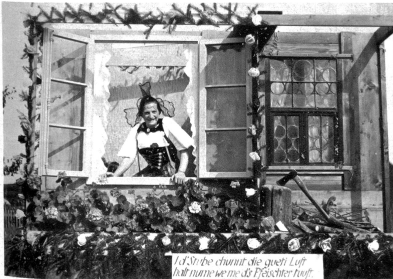
d'Nube chunt die gueti Luft halt nume we me d's Pfeischer tuuff.

Der wegen dem schlechten Wetter ins Wasser gefallene Umzug in Schwarzenburg, der über tausend Teilnehmer umfaßt, wird morgen Sonntag durchgeführt. Die prächtigen Bilder geben ein künstlerisch anschauliches Bild aus dem Amt Schwarzenburg im Wandel der Jahrhunderte.