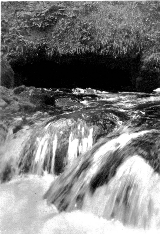
Vallorbe, La Source de l'Orbe.