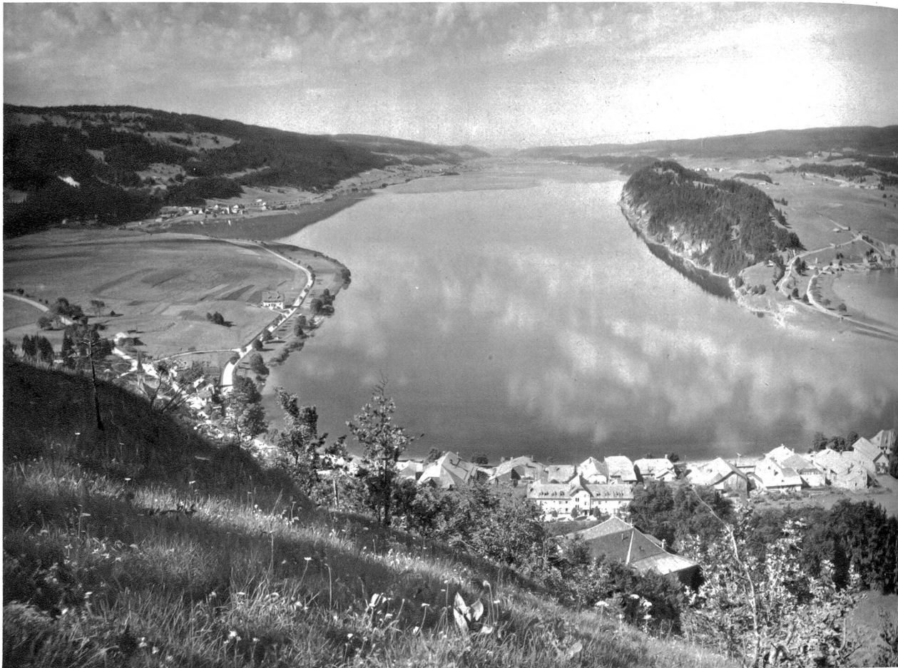
Lac de Joux, rechts Lac de Brenet mit Le Pont im Vordergrund.