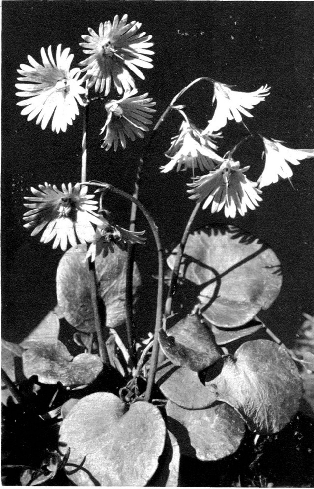
Alpenglöckchen. Soldanella alpina .