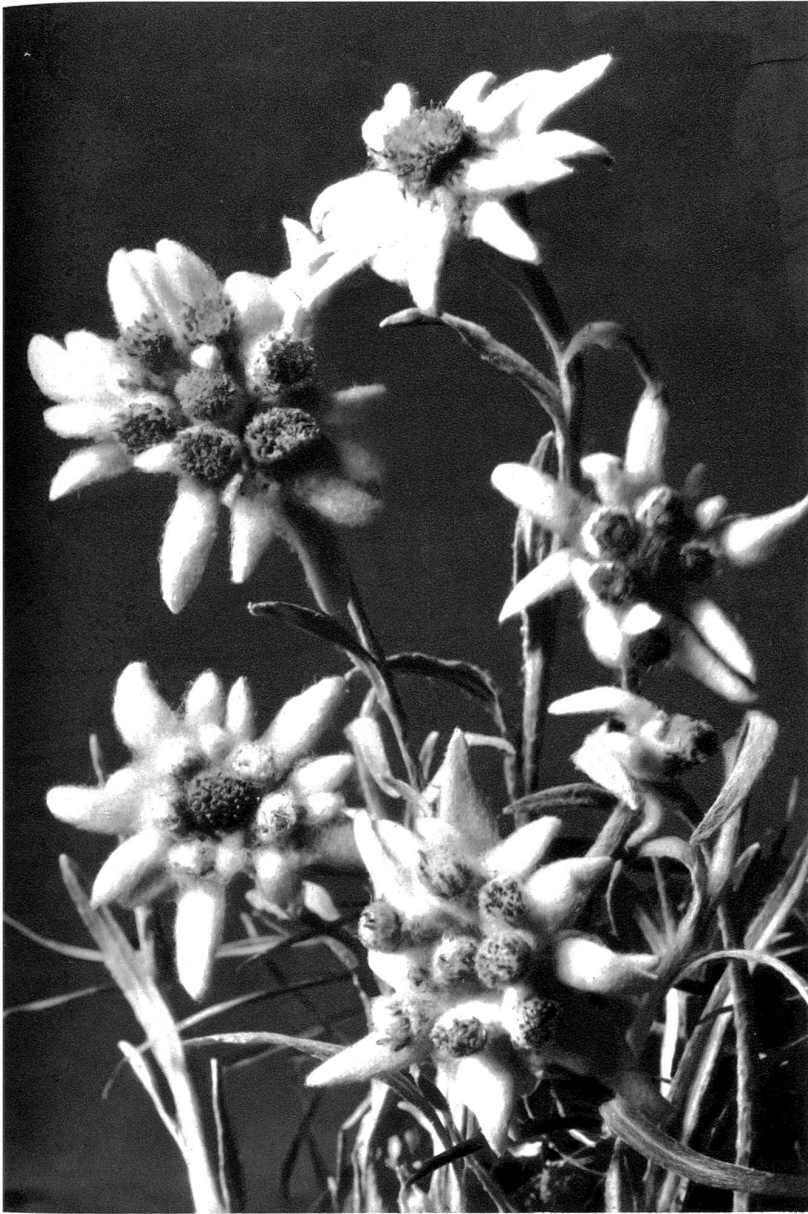
Edelweiss Leontopodium alpinum

Im Sommer braucht die Heimat stärksten Naturschutz. Besonders in den Bergen, wo unserer Pflanzenwelt durch die Menschen arger Schaden zugerichtet wird. Und doch machen gerade unsere Bergblumen, aber auch die im Tiefland, einen Teil des landschaftlichen Reizes aus, der alljährlich im Sommer die Menschen hinausziehen läßt, um aus der Reinheit und Schönheit der Natur Erholung und neue Kraft zu schöpfen. Dieser Reisetrieb mit seinen Massenwandererscheinungen bildet aber zugleich für die Pflanzenwelt eine große Gefahr, denn viele begnügen sich nicht mit dem Sehen, sondern wollen auch besitzen, obwohl die abgebrochene Pflanze meist rasch in der heißen Hand vertrocknet und kaum eine mehrstündige Reife frisch übersteht. Leider wird dieses Pflückbestreben immer noch zu sehr von den Einheimischen unterstützt, die trotz bestehenden Vorschriften geschützte Pflanzen feilbieten und nicht daran denken, daß sie allmählich ihre Heimat des schönsten Schmuckes und damit eines starken Anreizes zu ihrem Besuche berauben.