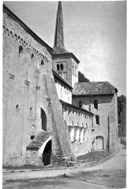
Die berühmte romanische Kirche in Romainmôtier.