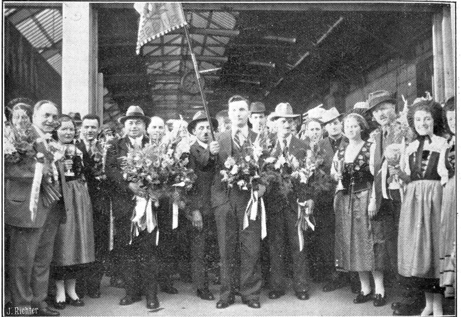
Begeisterter Empfang unserer Matcheschützen in Zürich.