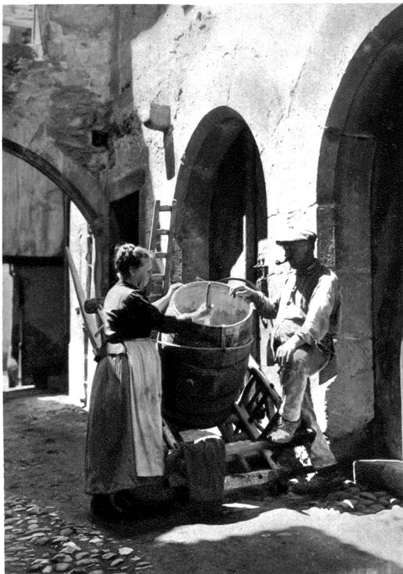
In den Bielerseedörfchen ist alles im „Wärch“ für die Rebarbeiten (Bild links)