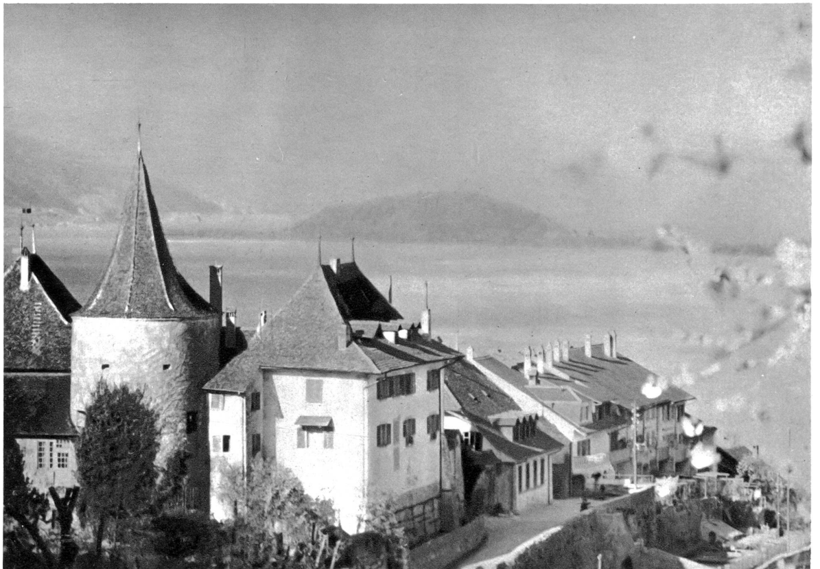
Erlach mit Blick gegen die Insel

Maggingen, dem Twannberg oder auf Prägels verschlafen, der andere sah gerade bei einem Gericht blauer Seeforellen, während die Sonne purpurn und strahlend, Farbenwunder wirkend, hinter dem Jura schlafen ging. Ueberhaupt die Stimmungen am Bielersee. Diese geben Farbenzusammensetzungen wunderlichster Art, und ich kann mir ein Lautenband von richtigen Bielerseebummlern nicht anders vorstellen als grün, golden, weiß und blau. Darin gestickt aber zartrosa und weiße Blumen gesichter und goldene Liebesworte. Ich bin überhaupt der Ansicht, daß, wenn sich am Bielersee Verwicklungen ergeben, ganz bestimmt der Liebesgott seine Hände im Spiel hat. Denn dem ist alles zuzutrauen, besonders am Bielersee, wo jedes Herz viel höher schlägt. In solchen Fällen gedeiht dann natürlich das „Lustspiel“ meistens nur bis zum Mittelakt. Den Schlußpunkt setzen dann erst daheim Vater und Mutter darunter!