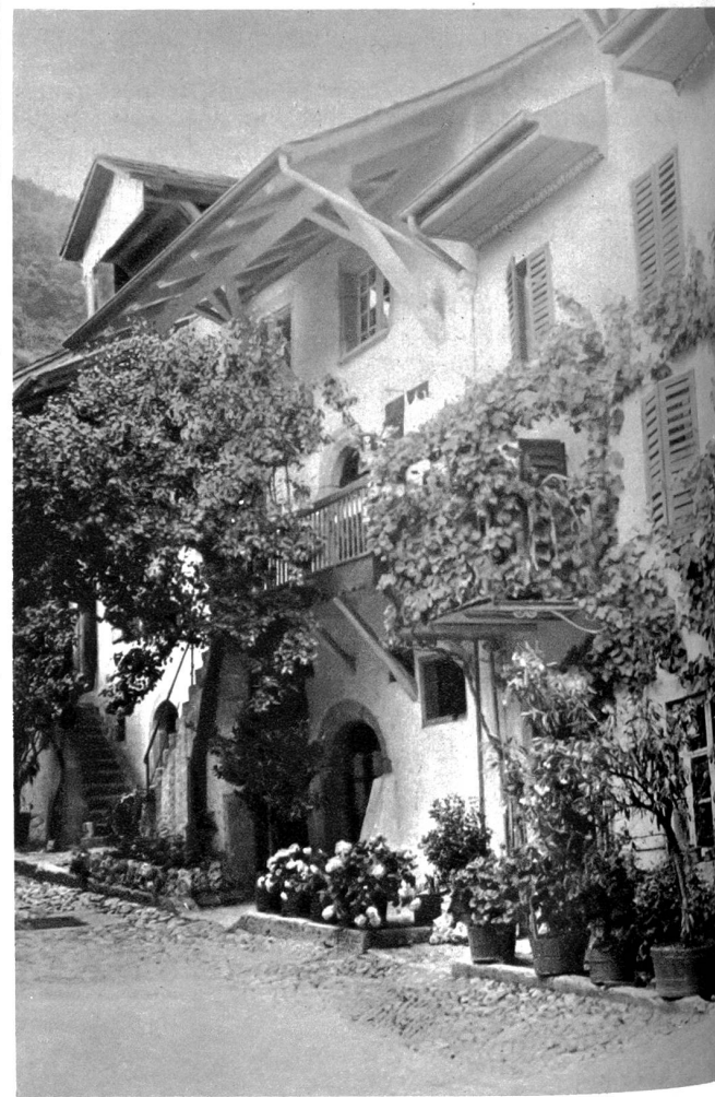
Studie aus Twann (Bild rechts)