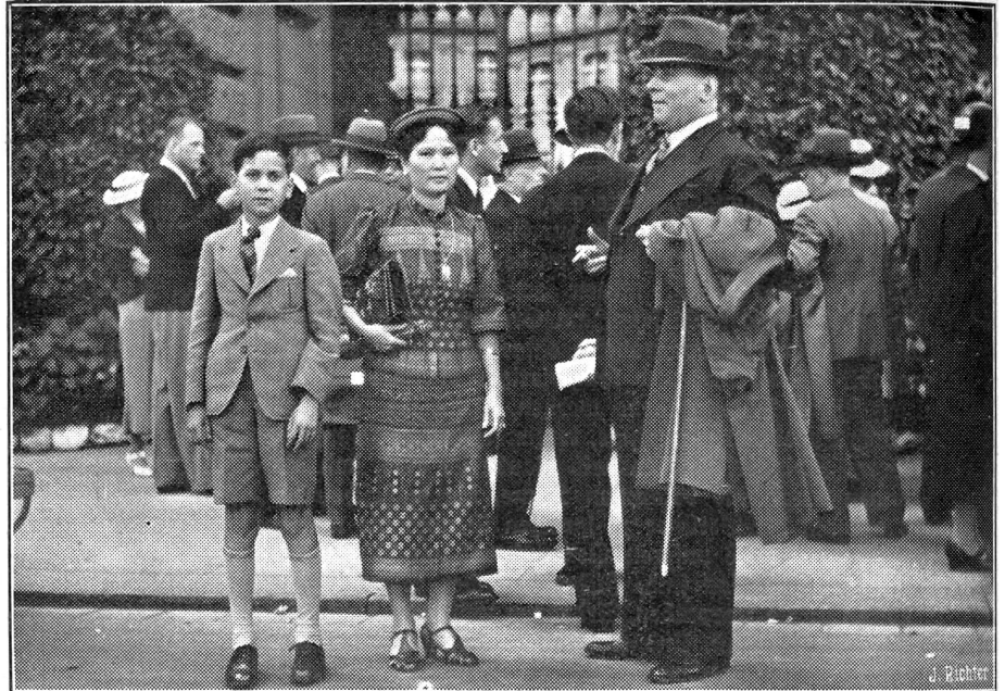
Auslandsschweizer in Bern

Die parlamentarische Behandlung der Freimaurerinitiative soll in der Herbstsession durchgeführt werden, damit die Abstimmung am ersten Dezembersonntag stattfinden könne.