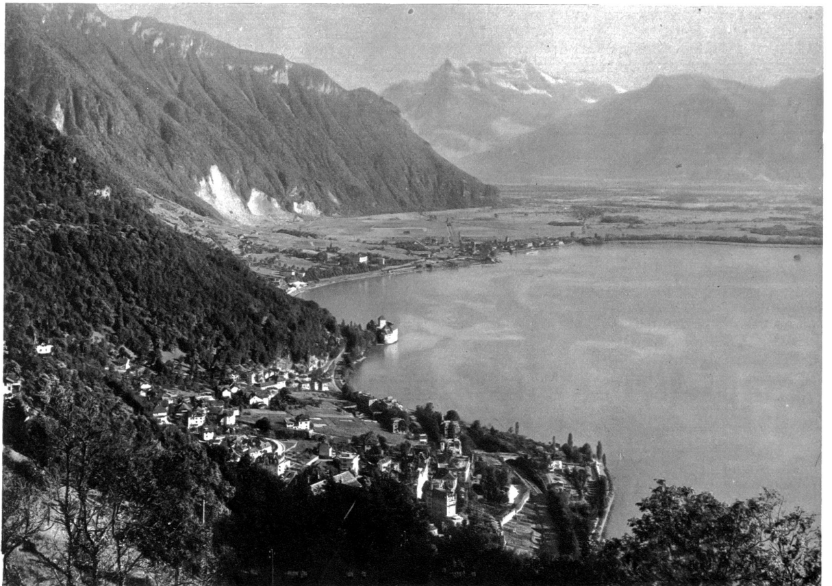
Chillon mit den Dents du Midi

Hofes . . . man mag den Todeschrei der Gemarterten aus dem Kerker hören oder schallende Kommandorufe und Soldatenschritte, Rasseln der Zugketten, Geklirr der Waffen . . . Stöhnen der Verwundeten. Und daneben doch wieder so viel Anmut und Lieblichkeit . . . Chillon . . . Schicksalsfeste durch Jahrhunderte!