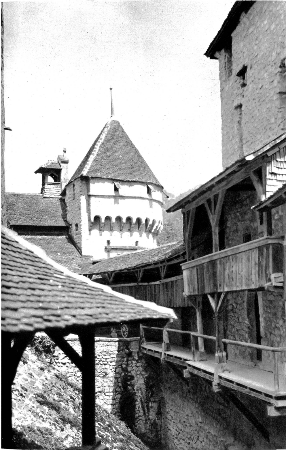
Ehrgang im Schloss

öfen von Sitten gehörte, die damit die Familie d'Allinge lehnten.