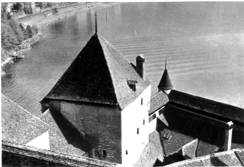
Blick auf das Schloss