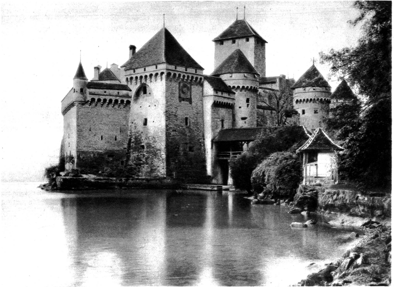
Schloss Chillon. Ansicht von Südosten

Räume mit dem leuchtenden Leben und den Kostümen dieser verklungenen Zeit ausschmücken, deren Spuren für immer verschwunden wären, hätte nicht moderne Forschung uns in den Stand gesetzt, die außerordentlich interessante Geschichte Chillons zusammenzufügen.