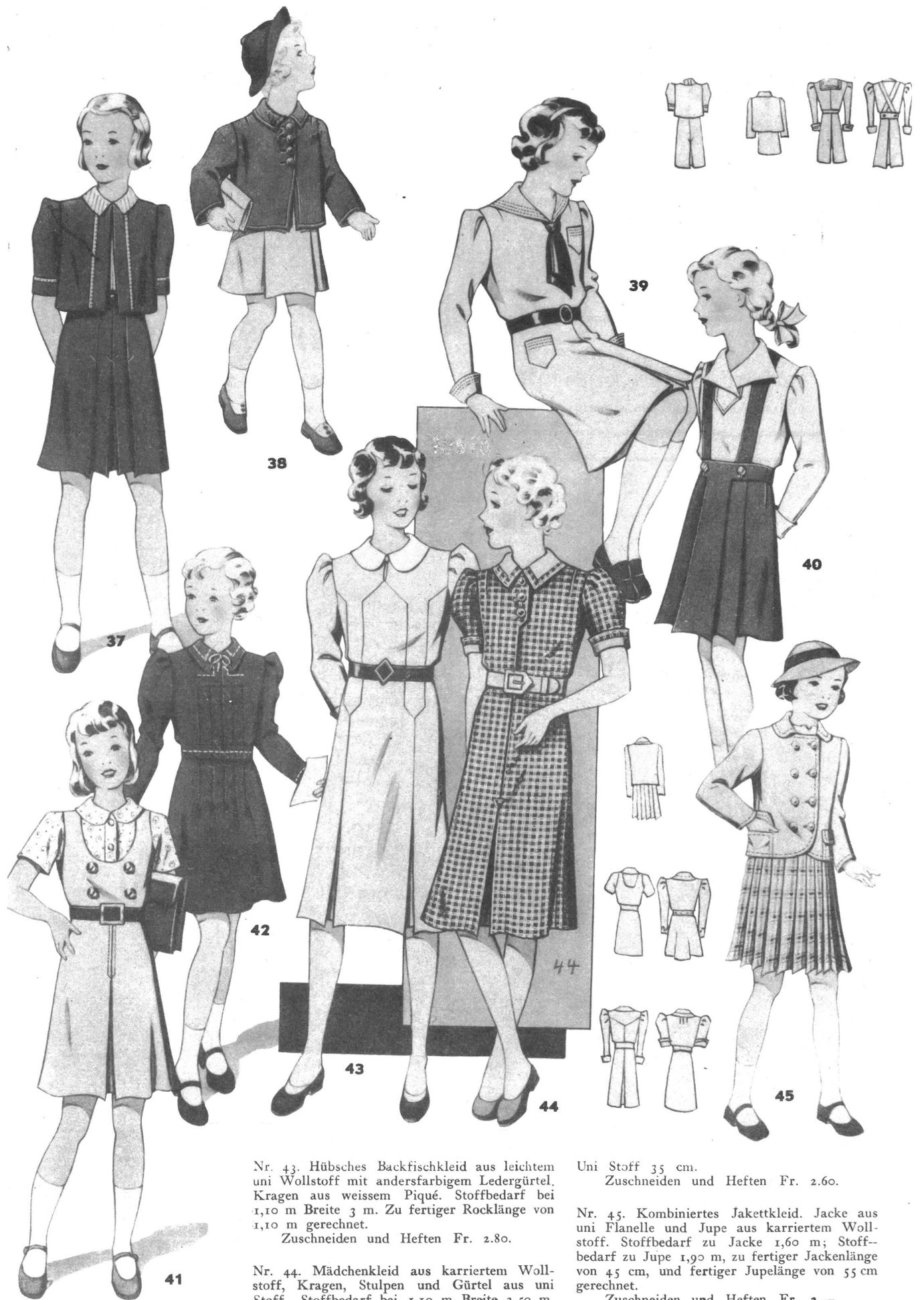
Nr. 43. Hübsches Backfischkleid aus leichtem uni Wollstoff mit andersfarbigem Ledergürtel. Kragen aus weissem Piqué. Stoffbedarf bei 1,10 m Breite 3 m. Zu fertiger Rocklänge von 1,10 m gerechnet. Zuschneiden und Heften Fr. 2.80.