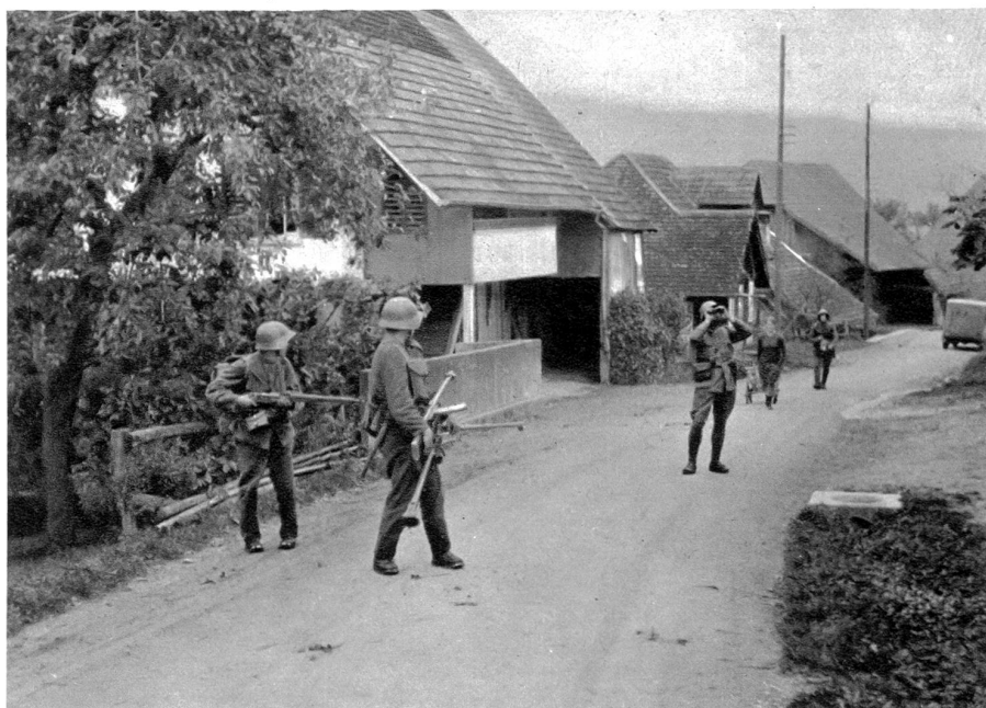
Manöver? Die heutige „Leere des Schlachtfeldes“. L.M.G. geht in Stellung