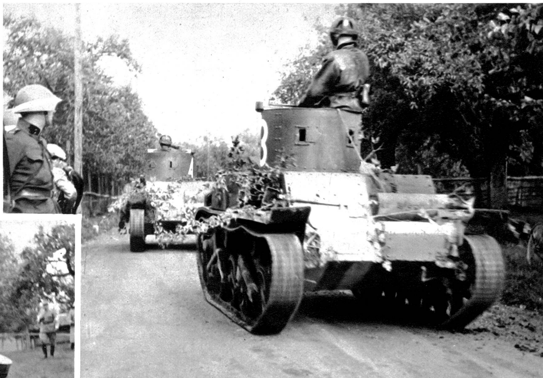
Panzerwagen im Limpachtal