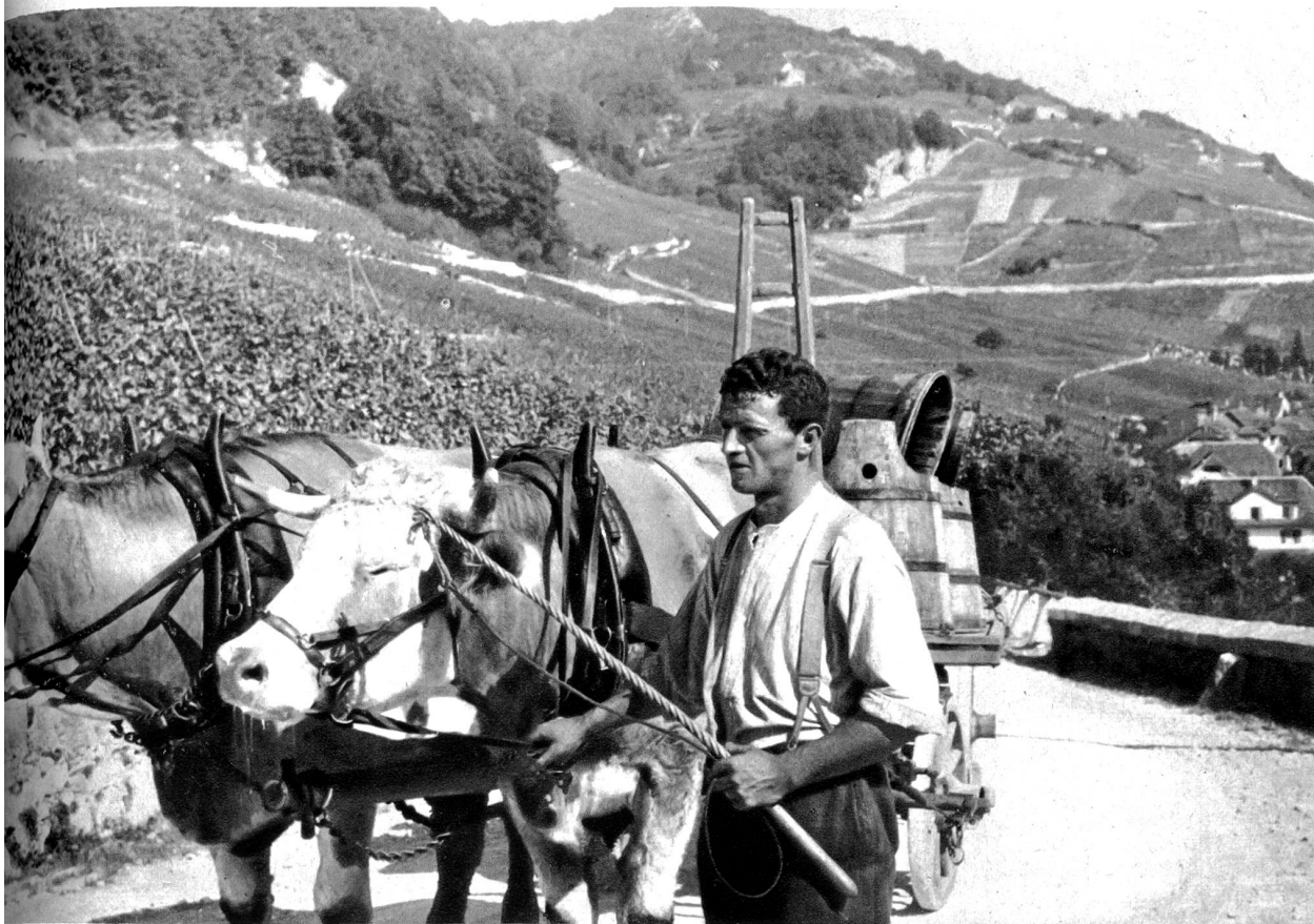
Es git e grossi, gueti Fuehr