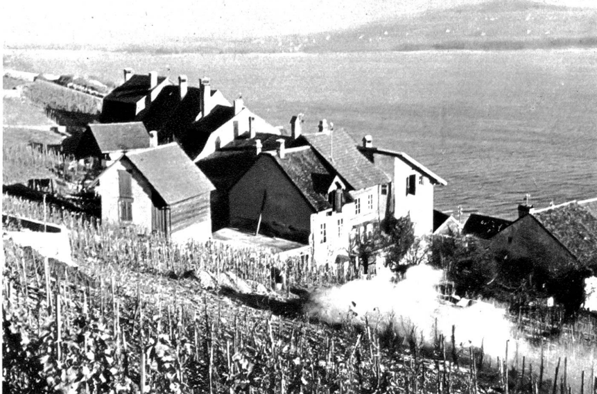
Tüscherz am See