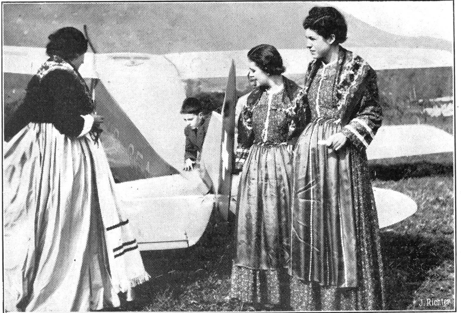
Erstes Flugmeeting in Lugano.

Der Bundesrat nahm Kenntnis vom Ertrag der Zölle im September und vom Ertrag der eidg. Stempelabgaben in den ersten 9 Monaten des Jahres. Die Zoll-