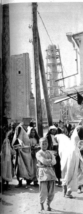
Die Koranschule. Sie ist streng geheim, denn die Sowjets setzen auf Koranlehren hohe Strafen (oberes Bild)