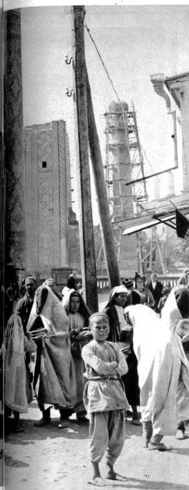
Der „Registan“, der schönste Platz der Welt