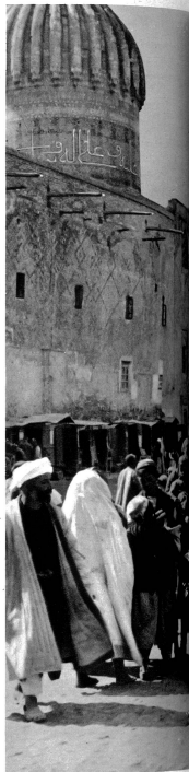
Der „Registan“, der schönste Platz der Welt