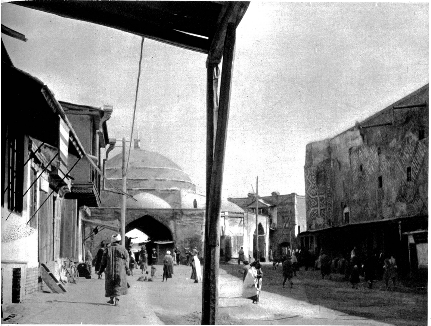
Im alten Samarkand