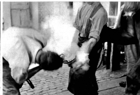
Das glühende Eisen wird angepasst.

vorher schon verloren war, das Schneiden des Hufes, das Verpassen des neuen Eisens, das erhitzen in die richtige Paßform geschlagen wurde und endlich das An-nageln des Eisens Stundenlang konnten wir vor der rauchigen Schmiede stehen und wir wurden nicht müde zuzusehen und immer wieder zuzusehen. Es war für uns ein geheimnisvoller Zauber mit dieser Schmiede. Aus hellem Tag sahen wir in das mythische Haldunkel des Raumes, wo der Schmied vor der Esse stand oder das glühende Eisen schlug. Die heutige Jugend wird wenig mehr vom Hufe schmied wissen. Sie steht dafür vor Autogeschäften und unterhält sich über 6, 8 oder 10 Zylinder, Kompressoren und Schwingschichten.