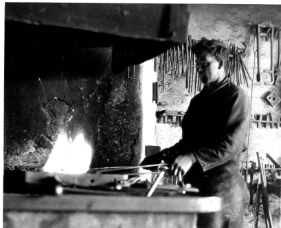
Das Eisen wird zum Fertigpassen ins Feuer gelegt und in die genaue Form geschmiedet

Verändert ist das Bild unserer Strassen seit Elektrizität und Motor unsere Verkehrswertzeuge bewegen. Nur selten begegnen wir in den Strassen der Stadt einer Pferdewirtschaft. Sie erscheint uns als ein Überbleibsel alter guter Zeit. Wir müssen schon aufs Land gehen, um hier bei der Feldbestellung, auf der Landstrasse diesen treuen Begleiter des Menschen noch weiter zu finden und zu beobachten. Aber auch hier hält die neue Zeit, hält der Traktor, hält die Elektrizität ihren Einzug und sucht das alte von seinem Platze zu verdrängen. Die Hufe schmiedefabrik, die einstmal die Grundlage des Schmiedehandwerkes war und deren Betrieb in guten Gegenden wirklich „einen goldenen Boden“ besaß, ist durch die Neuordnung der letzten Jahrzehnte auch zurückgebrängt worden. Wir erinnern uns aber noch alle gerne der Zeit, wo wir auf dem Lande vor der offenen Schmiede standen und sahen, wie Gila, Ufa oder Fanna zum Beschlagen geführt wurden, wie das Pferd angebunden wurde und dann die Arbeit des Schmiedes begann: das Abnehmen des alten, schadhaften Eisens, wenn es nicht