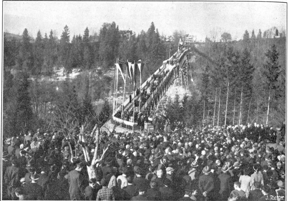
Einweihung der grossen Brücke über das Hundwiler Tobel.

So bringt das Finanzprogramm schließlich an Einsparungen und Einnahmen, statt die vom Bundesrat beantragten 223, im-