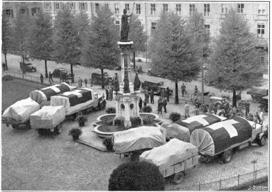
Liebesgabensendung für die Schweizer in Spanien.

In der Thurgauischen Volksabstimmung vom letzten Oktober wurde die Vorlage über die Verkleinerung des Großen Rates von rund 150 auf 110 Mitglieder mit 16,610 gegen 7828 Stimmen angenommen. Die zweite Vorlage, die eine Verlängerung der Amtsdauer der sämt-