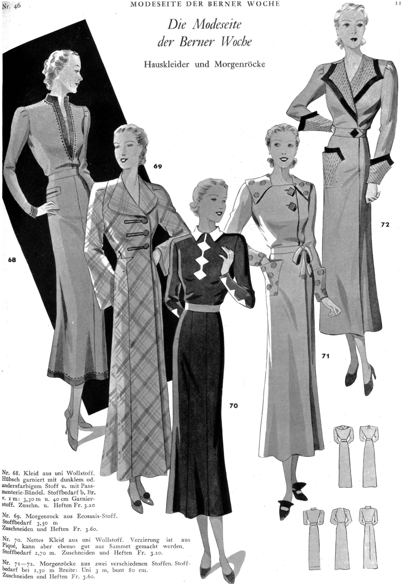
Nr. 68. Kleid aus uni Wollstoff. Hübsch garniert mit dunklem od. andersfarbigem Stoff u. mit Passmenterie-Bändel. Stoffbedarf b. Br. v. 1 m: 3,30 m u. 40 cm Garnierstoff. Zuschn. u. Heften Fr. 3.20