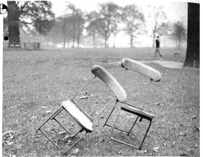
Einer sucht am andern Anlehnung

Und noch trauriger als die Menschen sind die Stühle, die Stühle im Hydepark. Kurz vor Einbruch des Herbstes hatte man sie hereinnehmen wollen, schön geschichtet, brav aneinandergedrängt, stehen sie in Dreierreihen mit elegant geknickten Beinen, vornehmen alten Männern aus dem vorigen Jahrhundert ähnlich, zu einem letzten Lätzchen bereit. Doch niemand kommt, der sie auffordern würde, der Nebel ist über London hereingebrochen, verlassen warten die Stühle im Hyde-Park. Einer sieht aus wie der andere . . . glaubt man auf den ersten Blick, wenn man über die verodeten Wege des vollstümlichsten Londoner Parks wandelt und das Auge auf die armseligen hölzernen Gefellen fällt, die im Sommer so heiß begehrt werden und sich für „Tappens“ — für two pennies, also etwa sechszehn Schweizer-Centimes — den ganzen Tag zur Verfügung stellen. Und doch hat jeder einen anderen Charakter, sogar bei diesem schlechten Wetter fällt das auf. Aus den vornehmen alten Herren mit der steifen Etikette werden bei einer anderen Gruppe verlassen an Bäumen lehrenden Sitzgelegenheiten hübsche, verführerisch aneinandergelehnte Girls eines Großstadtvarietés. Einige Schritte weiter hat sich ein Kränzchen Kaffeetanten zusammengesetzt zu lustigem oder auch, wie man verstehen wird, verdrießlichem Schwatz. Dort lehnen sich, wie Kinder, die miteinander spielen, zwei Hydepark-Stühle mit den Rücken gegeneinander. Wer mag