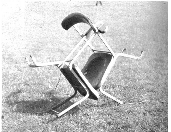
In Freundschaft umschlungen