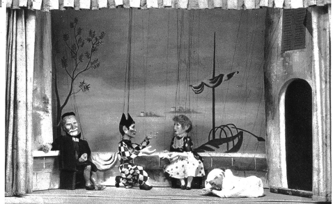
Bühnenbild aus einem schweizerischen Marionettentheater. Hier genügen dünne Fäden um die Figuren zu führen. Auch das Grössenverhältnis der Puppen zur Bühne ist ganz anders wie bei Bild 4

Eisendrähte, eigentlich besser, Eisenstangen verwendet werden, um diese schweren, gewichtigen Persönlichkeiten auf der Bühne ihr Leben abwickeln zu lassen. Sind unsere Marionetten sehr individuell gestaltet, Kunstwerke guter Bildhauer und Maler, so fallen uns in Sizilien die naturistischen Köpfe auf, sowie der gleichmäßige Gesichtsausdruck der Puppen. Trotz gewisser scheinbarer Mängel ist aber die Wirkung auf den Zuschauer eine nachhaltige. Mächtig stampfen die Kraftfiguren in goldenen Rüstungen über die Bühne, Kämpfe toben, Köpfe rollen, donnernde Worte unterfüllen das heldenhafte Gebaren, eine große Erschütterung geht durch's ganze Theater. . . Ein schweizerisches Puppentheater bedingt alles in allem etwa 15—20 Personen, in Sizilien waren 2 Menschen die geführt, gesprochen und alles inszeniert haben.