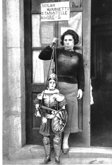
Diese Frau führt mit ihrem Bruder das Marionettentheater ganz allein. — Man achte auf das Grössenverhältnis der Figur.