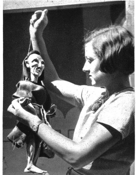
Wie zierlich und leicht wirkt dagegen eine Schweizerpuppe

Das Spiel mit Marionetten weist Künlichkeiten auf, von denen leider immer noch viele Menschen kaum eine Ahnung haben. Diese Puppen an Fäden können bei sorgfältiger Vorbereitung ungemein lebensvoll und echt wirken, es liegen zudem Möglichkeiten vor, mit denen das „richtige“ Theater kaum konturrenzieren kann, und außerdem sind auch heute noch die Ziele, die sich ein gutes Marionettentheater setzen darf und soll, fast unerreicht. Nun gibt es auch auf diesem Gebiet sehr verschiedene Darstellungsmöglichkeiten. Wir zeigen hier im Bilde einige Motive von einem echt sizilianischen Marionettenspiel, und nur zum Vergleich seien zwei Gegenüberstellungen aus schweizerischen Bühnen gebracht. Sofort fallen uns große Gegensätze auf. Während die Schweizerpuppen an dünnen Fäden hängen, ca. 40—55 cm groß sind und in ihrer Stierlichkeit sehr leicht bewegt, selbgeführt werden können, können wir uns der gegenteiligen Art des sizilianischen Theaters. Wir sehen da Riesenfiguren, die oft mehr als ein Meter groß sind und ein Gewicht von 20 bis 40 Kilo pro Puppe aufweisen. Natürlich genügen da dünne, kaum sichtbare Fäden nicht um sie zu führen, es müssen solide