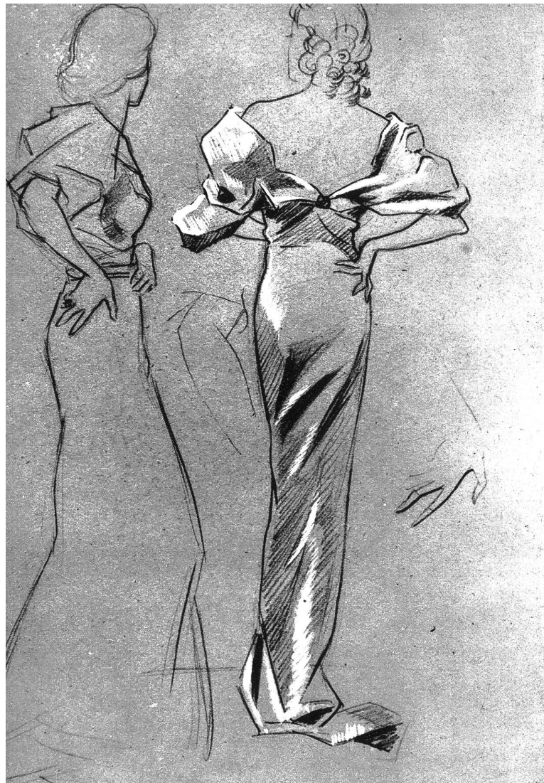
Modeklasse. Studie nach bekleidetem Modell

starren Formen verharren; ein steter Fluß, fortwährende Veränderlichkeit tritt gerade auf diesen Gebieten klar zu Tage. Deshalb wirkt der Unterricht nie schematisch, sondern mit seiner Lebenswirklichkeit stets interessant.