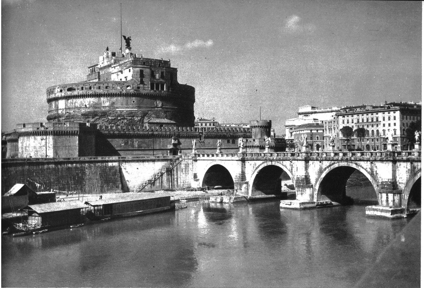
Engelsburg und Engelsbrücke