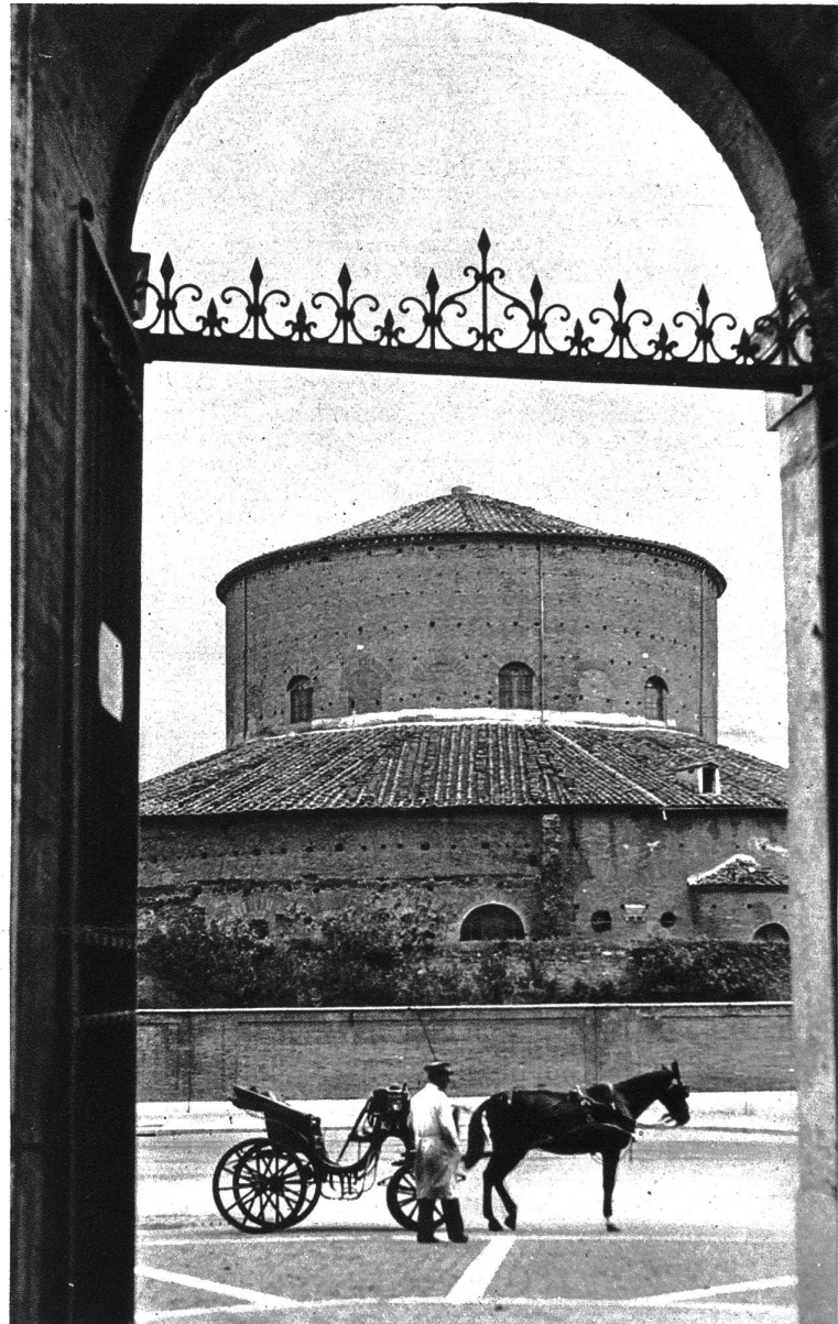
San Stefano Rotondo

Doch man kann nicht immer nur schauen und studieren: erdrückend wäre sonst Rom. Da umfassen uns erholungsreich seine prächtigen Parks. Gibt es einen abwechslungsreicheren als den des Monte Pincio? Es ist Sonntag. Römer und Römerin, ideale Flaneurs, ziehen über die Spanische Treppe zu ihm hinauf, gelöst, fest froh, so als hätten sie mit energischem Druck ihren Alltag ausgeschaltet. Auf breiten Fahrwegen ergießt sich der Corso der Gefährte, rossespannter und motorisierter; auf baumbepflanzten Fußpfaden lustwandelt die heitere Fußgänger- masse; auf freundlichen Spielplätzen tummeln sich beglückte Kinder. In langen Reihen erinnern Büsten hervorragender Italiener an Verdienste um Geschichte und Kultur. Den ruhebedürftigen Träumer aber bergen idyllische Winkel, nicht selten an geschmackvollen Brunnenanlagen. Hier mag er rasten und am Geiste vorbeiziehen lassen, was er pilgernd gesammelt: die Jahrtausende der Ewigen Stadt.