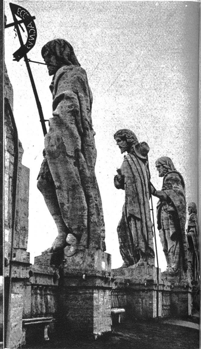
Heiligenstatuen auf dem Dache des Petersdomes.