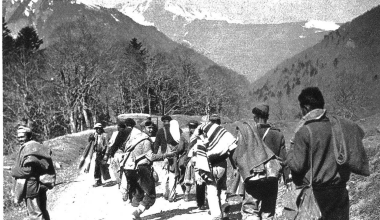
Die Ankunft eines Flüchtlingszuges in Luchon (Südfrankreich)