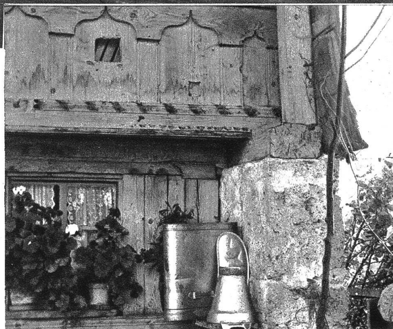
Partie am Schloss Grandson.

Liebe, kleine Bilder, es geht ja doch nicht. Ihr seid zu viel! Aber . . . kommen werden wir wieder und das bald! W. S.