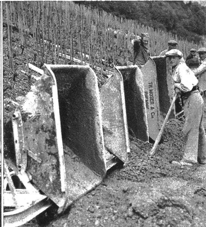
Bau der Rebstrasse