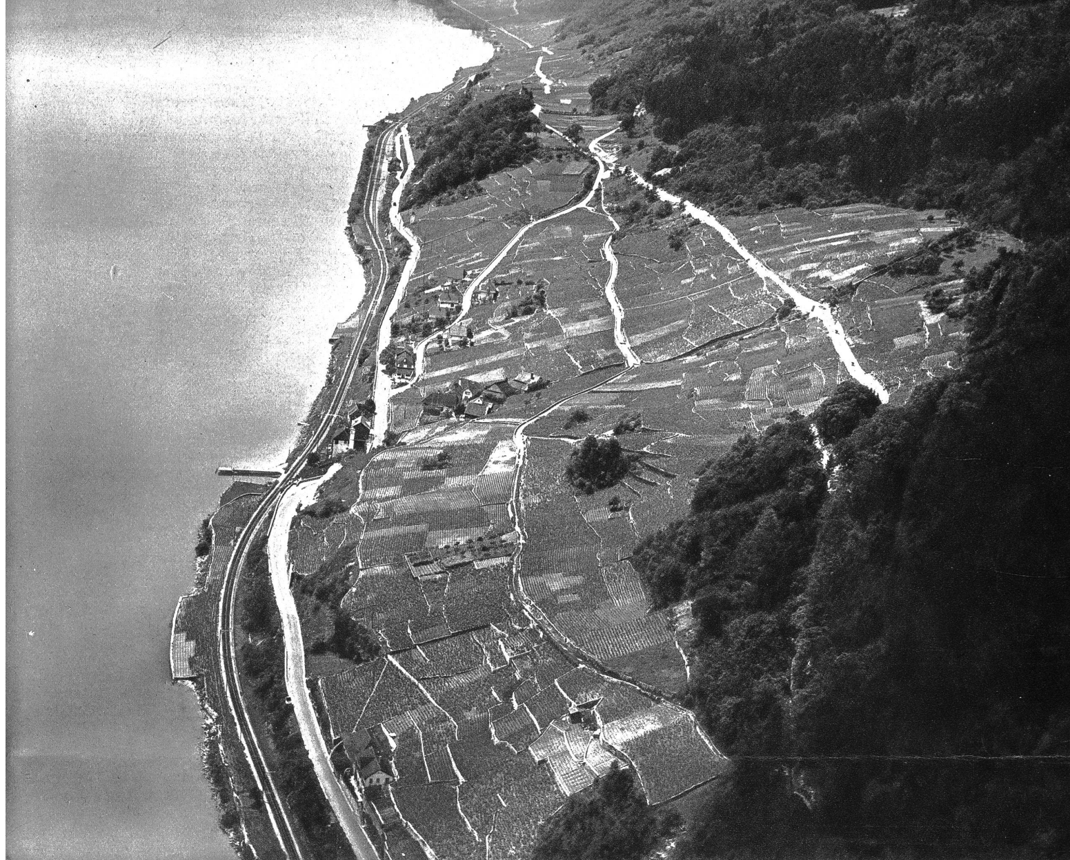
Bei Alfermée (Bielersee)