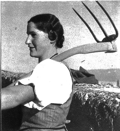
Harte Arbeit erfordert der Rebbau