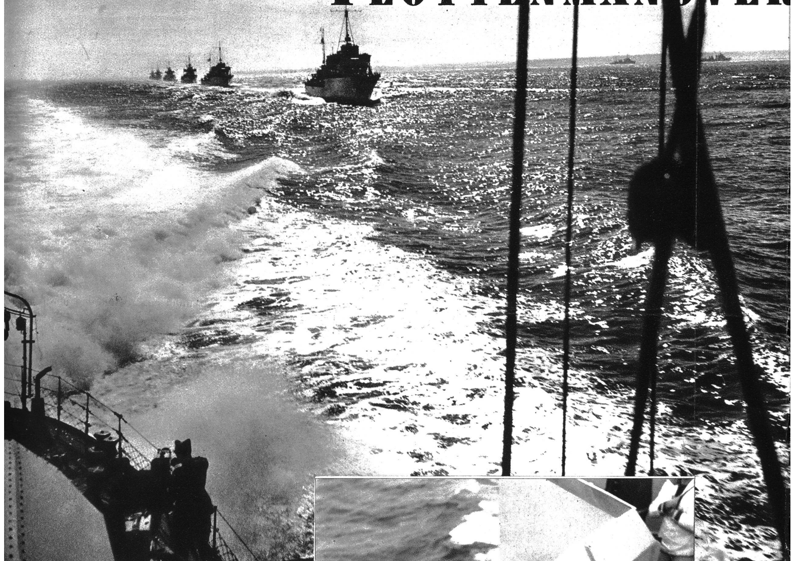
Die Zerstörer-Flotille in Kiellinie