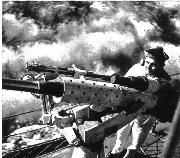
Am Fliegerabwehrgeschütz wartet dem Matrosen eine schwere Aufgabe

Einem unserer Mitarbeiter wurde die Erlaubnis gegeben, während der französischen Hochseemanöver auf dem Flaggschiff zu photographieren. Was er nach Hause brachte, geben wir hiermit unsern Lesern wieder, ihnen damit eine neue Welt erschließend. Leider eine Welt von Vernichtung und Tod. Was könnten mit den Milliarden, die von allen Staaten in die Hochseeflotten investiert werden, für Kulturwerte geschaffen werden! Erleben wir wohl noch einmal die Zeiten, wo die Völker zueinander wieder Glauben und Vertrauen fassen? Oder besteht der „Weltfriede“ in den ungeheuren Aufrüstungen?