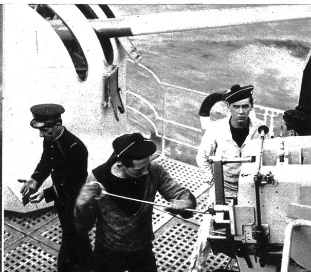
Rechts: Nach dem Schuss wird das Geschütz gereinigt