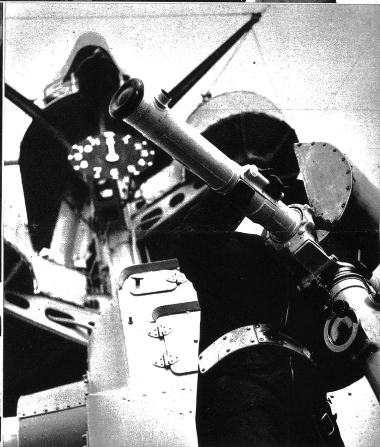
Am Entfernungsmesser wird die exakteste Arbeit verlangt