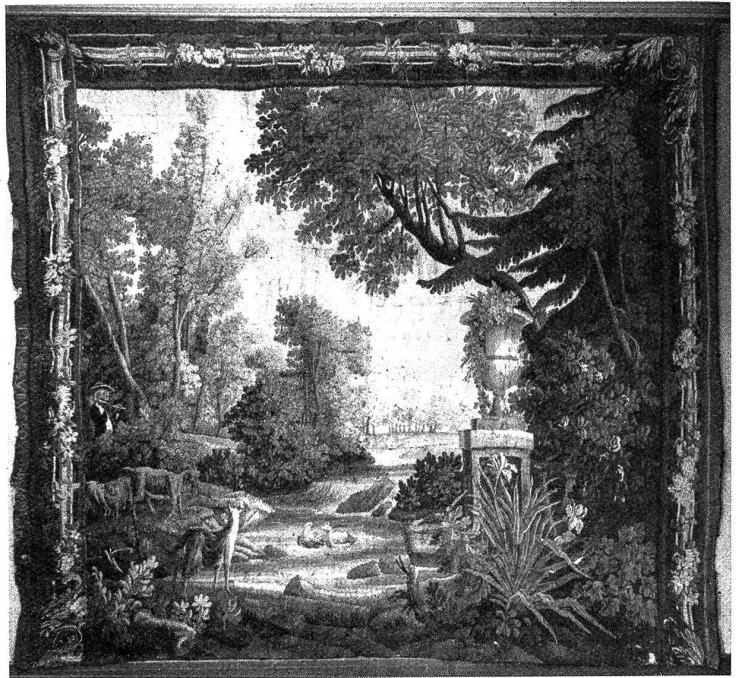
Wandbehang, aus dem XVIII. Jahrhundert.

Wie viel Verdruß und Ärger setzt es ab, wenn man erst nach Beendigung der Arbeit, die man irgendwo gekauft hat, zum Fachmann geht, um solche montieren zu lassen. Da paßt dann plötzlich die Größe nicht, entweder ist das Muster zu groß und es fällt ringsherum viel der so großen Arbeit ab, und das Muster ist nicht richtig angeordnet, oder die Arbeit ist zu klein und es muß noch angefügt werden, dann ist aber plötzlich die gleiche Wolle nicht mehr erhältlich. Ach, wie viele Klagen muß in dieser Beziehung der Tapezierer entgegen nehmen, nur weil sein Kunde diesen elementaren Grundsatz nicht befolgt und ihn als Fachmann nicht vor Anschaffung der Arbeit zu Rate gezogen hat. Also erntet sich vom gelehrten Tapezierer richtig beraten lassen.