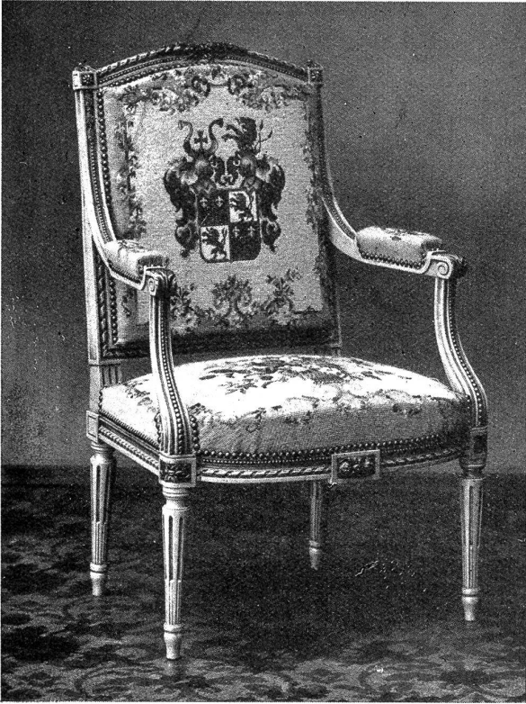
Louis XVI.-Fauteuil. Sitz Blumenmotiv, Rücken aufgesticktes Wappen. Grund demi-point. Ornamente in point de gobeelin und Wappen in petit point.

zum großen Wandbehang in Gobelinstich, petit point, oder Blattstich.