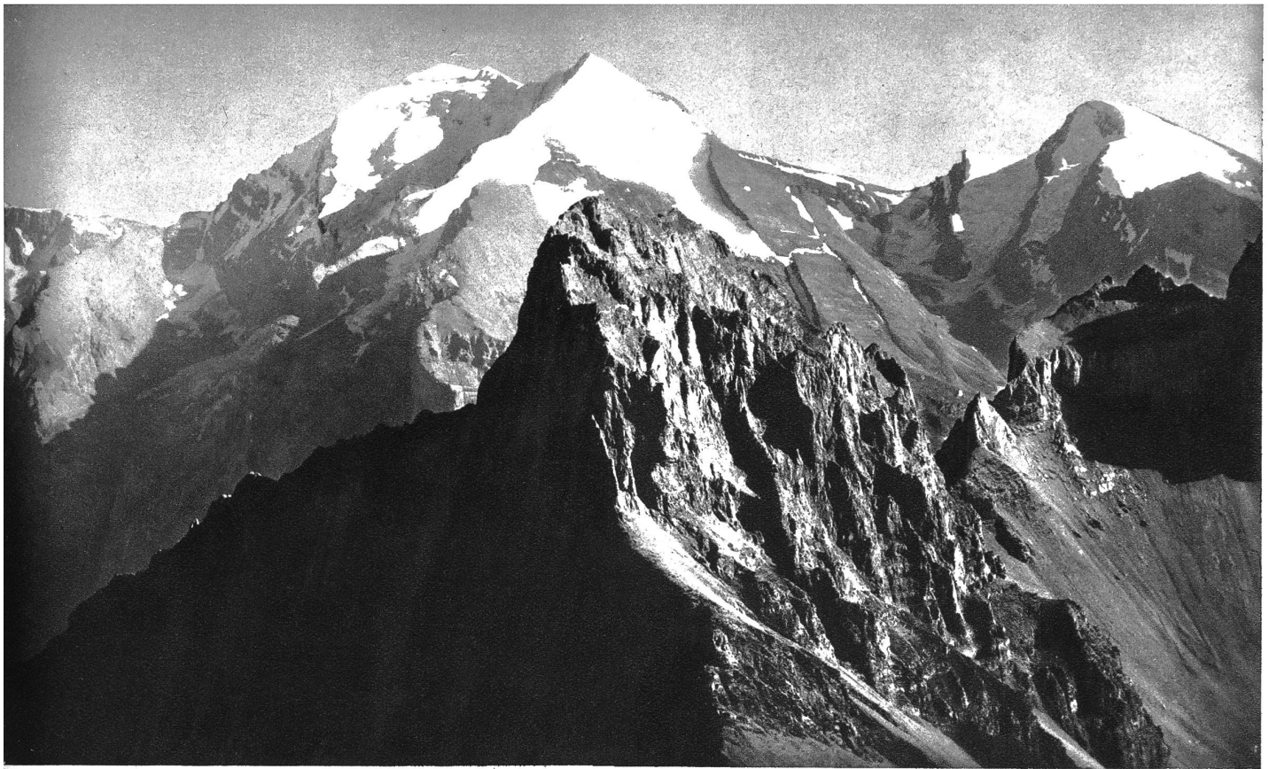
Klein Lohner, im Hintergrund Balmhorn-Altels, Rinderhorn