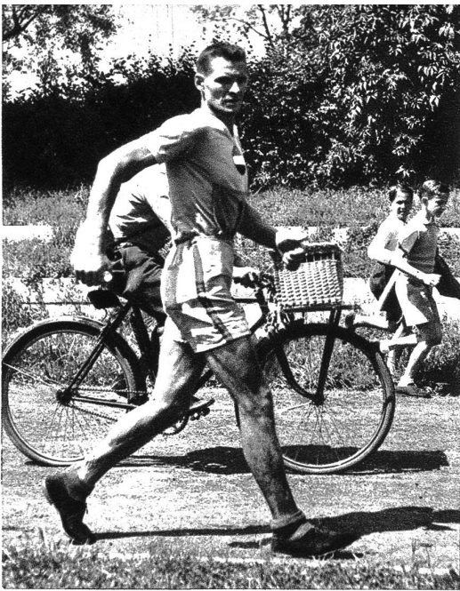
Ein Geher-Weltrekord wird in Lausanne geschlagen! — Der Franzose Florimond Cornet, der die Weltrekorde über 100 und 150 Kilometer schlug, während seines phänomenalen Laufes um den Genfersee. Auch die Gesamtstrecke wurde mit neuem Streckenrekord zurückgelegt.