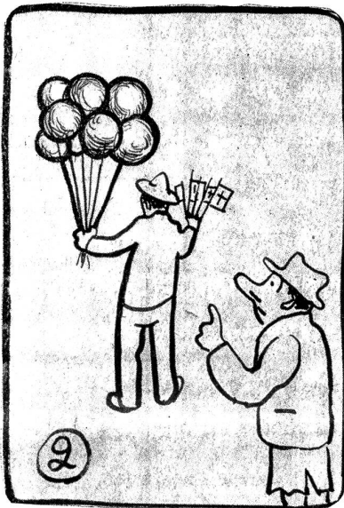
Bumps weiß sich zu helfen.