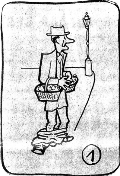
Bumps weiß sich zu helfen.

Geburten in Spitälern, von Kindern, deren Eltern in Bern wohnen, kamen in den Jahren 1921—1924 etwas über ein Viertel vor; im Jahr 1925 ein Drittel; seit 1933 waren es stets über die Hälfte.