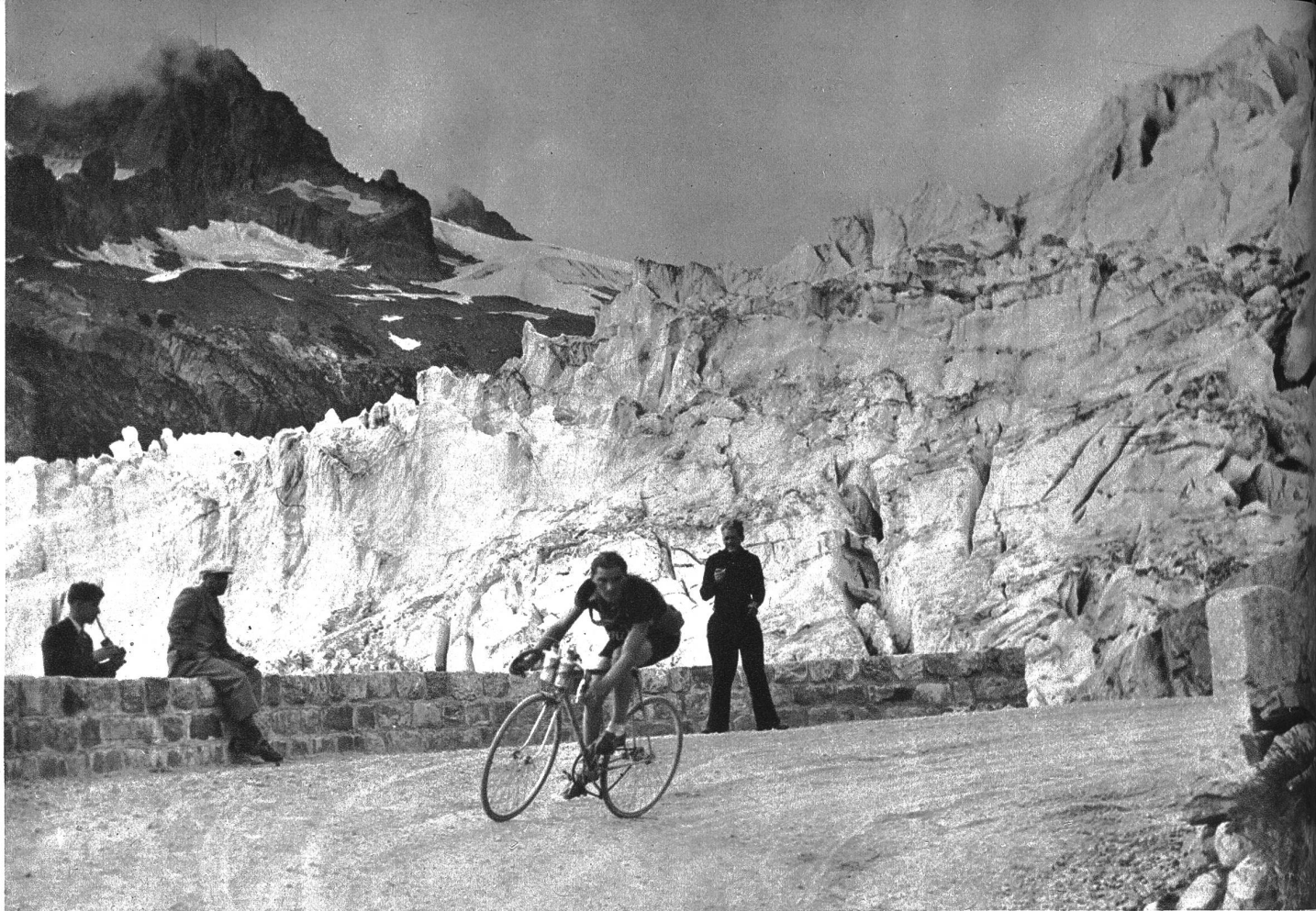
Tour de Suisse 1938. Erstmals die Furka (2436 Meter über Meer!) Der beste Mann der schweizerischen Radrundfahrt, der Sieger der diesjährigen Italienrundfahrt, Giovanni Valetti, in der Abfahrt von der Furka Passhöhe am Rhonegletscher vorbei nach dem Oberwallis. Valetti ist nicht nur der beste Bergfahrer der Tour de Suisse, sondern ist auch ein unübertrefflicher Abfahrtspezialist. Ueberlegt nimmt er hier die Spitzkehre der Furkastrasse. Im Hintergrund der Rhonegletscher.