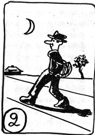
Bumps praktiziert Selbstversorgung.