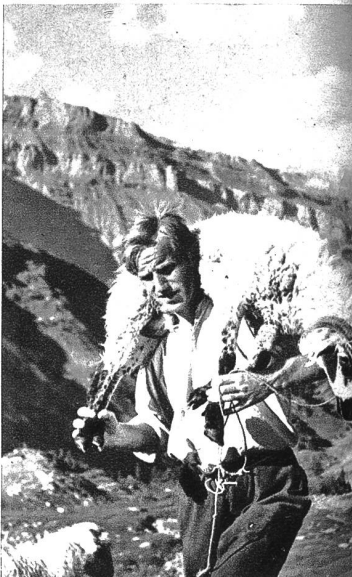
Ein Schaf wird von der obern Weide zur Schur gebracht.