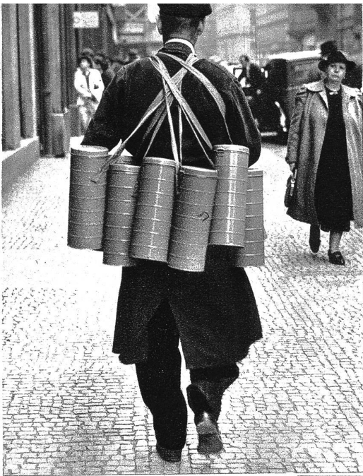
In Prag: Gasmasken für die Familie. Nach stundenlangem Anstehen konnte dieser Prager Bürger endlich alle acht Gasmasken erwerben, die er für sich und seine Familie anschaffte, um im Ernstfall vor Gasangriffen sicher zu sein. Ein Anblick, wie der auf diesem Bild, ist so alltäglich in Prag, dass sich niemand nach ihm auch nur umdreht.