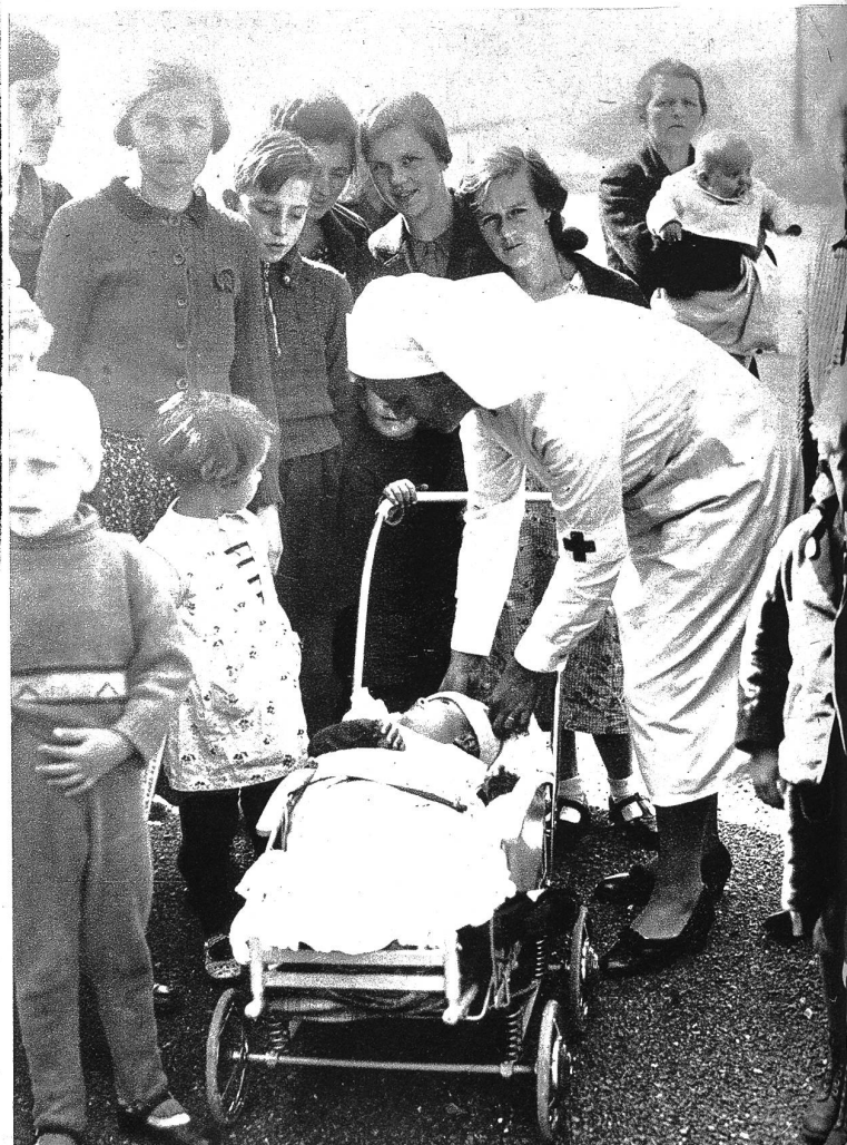
Flüchtlinge aus den tschechischen Grenzgebieten treffen in Prag ein. Auf Grund der bedrohten Lage in den Sudetendeutschen Gebieten sind Tausende von Flüchtlingen, Tschechen und Deutsche, in Prag eingetroffen, wo sie in besondern Lagern untergebracht u. betreut werden.