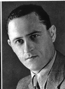
László Csabay, Tenorbuffo und Spieltenor