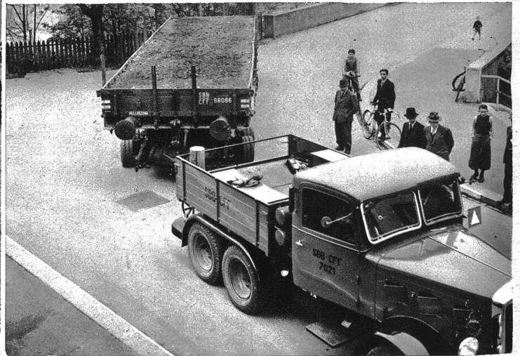
Der Zugtraktor bringt den Eisenbahnwagen an seinen Bestimmungsort — für Industrieunternehmungen ohne Geleiseanschluss, Private usw. sicherlich eine sehr dienliche Neuerung!