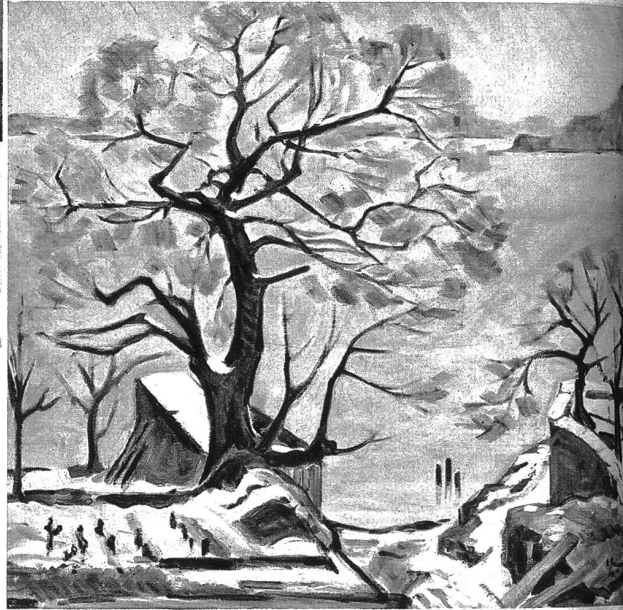
Winter am See

Viele können mit Geiger nichts anfangen, denn die Masse verlangt nach derber Kost in der Kunst, um diesen Ausdruck zu unterstreichen, und wie gerne lassen sich die Menschen heute verblüffen! Das Leise, Zarte, Harmonische, das Wesentliche also in