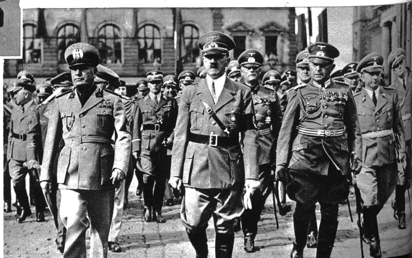
Die „Friedenskonferenz“ von München. Die Achse freundschaft Rom-Berlin und der persönliche Einfluss Mussolini: auf Hitler dürften den europäischen Frieden gerettet haben. Wir zeigen die beiden Staatsoberhäupter in München. Links Mussolini u. rechts Hitler.