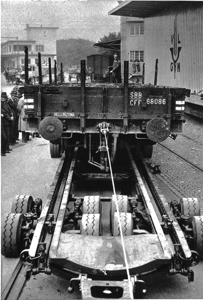
Eisenbahnwagen „ins Haus geliefert“! Eine Neuerung der Schweiz. Bundesbahnen. Am Dienstag wurde in Olten-Hammer der neue sog. „Rollschemel“ der SBB, vorgeführt. Es handelt sich um einen Transportwagen, der den Eisenbahnwagen vom Geleise nach beliebigen Bestimmungsorten bringen kann. Vermittelt eines Zugtraktors wird der auf dem Rollschemel verfrachtete Eisenbahnwagen dem Empfänger zugestellt. — Wir zeigen von dieser interessanten Neuerung der Bundesbahnen: Das Verladen des Eisenbahnwagens auf den Rollschemel.