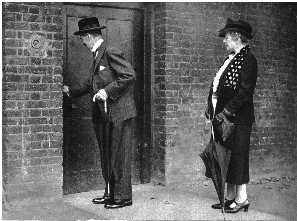
Hintereingang für Mr. Chamberlain. — Die internationale Krise hat nichts an Mr. Chamberlains Gewohnheiten geändert. Nach wie vor geht er täglich am Morgen mit seiner Gattin auf seinen gewohnten Parkspaziergang. Unser Bild zeigt Englands 69jährigen Premierminister und seine Gattin bei der Rückkehr vom Spaziergang.