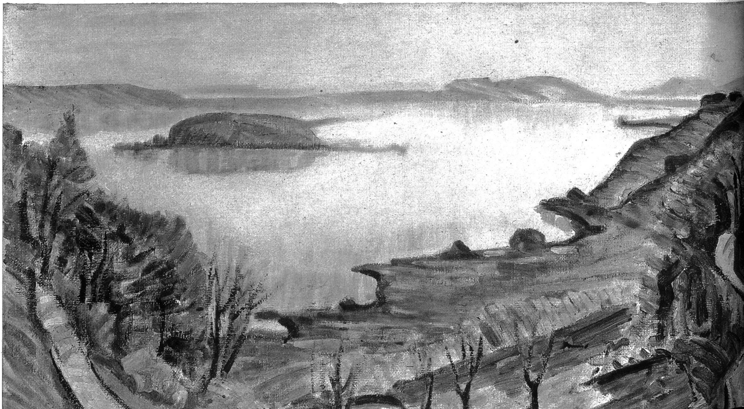
Abend bei Twann

Viele können mit Geiger nichts anfangen, denn die Masse verlangt nach derber Kost in der Kunst, um diesen Ausdruck zu unterstreichen, und wie gerne lassen sich die Menschen heute verblüffen! Das Leise, Zarte, Harmonische, das Wesentliche also in