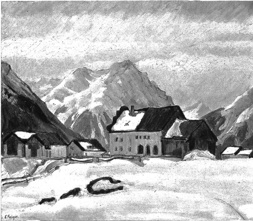
Winterlandschaft im Engadin