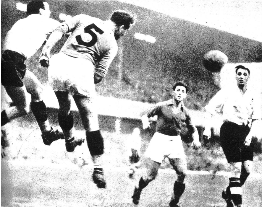
England gegen den Kontinent 3:0; das grosse internationale Fussballtreffen! — Olivieri und der Verteidiger Andreolo wehren vereint einen englischen Angriff ab. Rechts der englische Sturmführer Lawton.