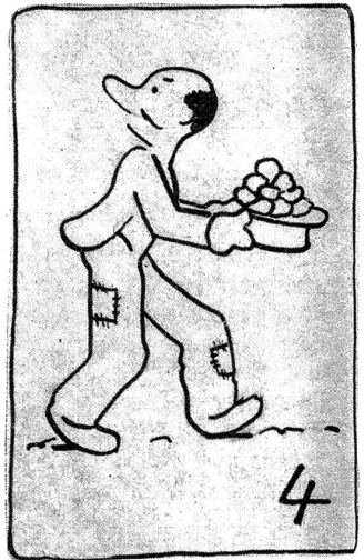
Bumps hat Erfolg.