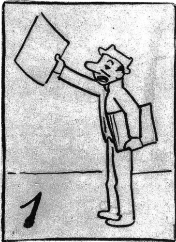
Bumps als Zeitungsverkäufer.