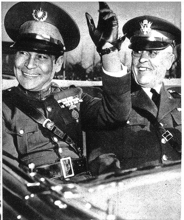
Oberst Fulgencio Batista, der frühere Feldweibel in der kubanischen Armee, u. jetzige Diktator der Republik Cuba, ist zu einem Besuch in der amerikanischen Hauptstadt Washington eingetroffen. Oberst Batista (links) bei seiner Ankunft in Washington, mit General Malin Gragg, dem amerik. Generalstabschef.