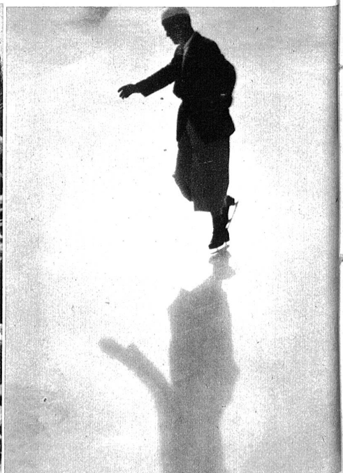
Bis in die Nacht hinein gibt's da für den Trainer und Lehrer nicht viele Mußestunden.