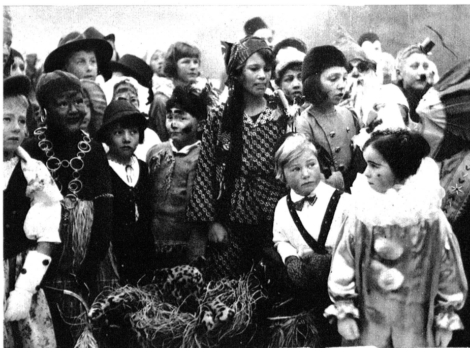
Für die Jugend wurde das Kostümfest zum alljährlichen Höhepunkt von Sport und Fröhlichkeit