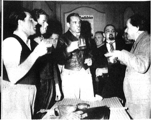
Die Zitgeischtklübler rufen ihren Klubspruch: „Zitgeischt, vorwärts Tempo, Tempo! Vorwärts Tempo, hopp hopp hopp!“

Dieses wertvolle Gegenwartstück, das letzter Tage durch das Berner Heimatschuhtheater mit großem Erfolg zur Aufführung gebracht wurde, kann als das reifste Grunder'sche Dialektstück betrachtet werden, das die Gegensätze der bodenständigen, schollenverbundenen bäuerlichen Ueberlieferung und dem tempo- und rekordfüchtigen Zeitgeist zur wirksamen dramatischen Gestaltung bringt. Die Worte des Better Sämi, die er an den der Heimat entfremdeten Neumattsohn Peter richtet, haben nicht nur der heutigen Generation viel zu sagen, sondern werden auch noch für die Zukunft ihre Bedeutung haben: „Da bisch du ganz uf em Holzwäg u zeigst, daß du öppis wosch schyne, wo mir nie chöi sy. Mir Bureküt müessen äbe nid meine, mir wölle mit aller Lüüfels Gewalt de Stadtküte nahemache. Zu däm, wo mir vo üsne Vorfahre g'erbt hei, müesse mir Sorg ha, sig's im Husrat, i der Bouart, sig's i de Brüüch, i de Chleider, im Rede oder im Lied. Uf das sölle mir stolz sy; aber dä Burestolz füehrt me nid mit Löff un Auto desume. — Das söll o ne Zytgeist wärde, aber eine wo ufrichtet u nid z'hodeschryft. Uf ds Alte, wo uf festem Grund und Bode steit, mueh me ds Neue stelle; de git's en Ufrichti, wo dür alli Zyte het.“