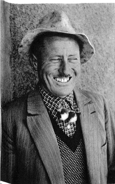
Einer von denen, die sich über unsern Aprilscherz und die Hereingefallenen ergötzen.

Wir bitten alle diejenigen, welche sich letzten Samstag zwischen 2 und 5 Uhr mit Ueberkleidern und genagelten Schuhen auf den Spiegel hinauf bemüht haben, um Entschuldigung; wir können ihnen zu ihrer Beruhigung versichern, daß wir auf eindringlichen Wunsch der Beteiligten davon absehen wollen, ihre zum Teil verdugten, zum Teil recht erzürnten Gesichter, die unser Photograph aufgenommen hat, hier im Bilde zu veröffentlichen. Sollte hingegen wirklich einmal eine Höhle am Gurten entdeckt werden, dann werden wir nicht verfehlen, sie alle in erster Linie und vor allen übrigen Leuten wieder zum Besuche einzuladen.