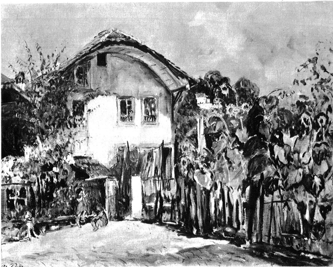
Adolf Tièche. Altes Haus im Nydeckhöfli.