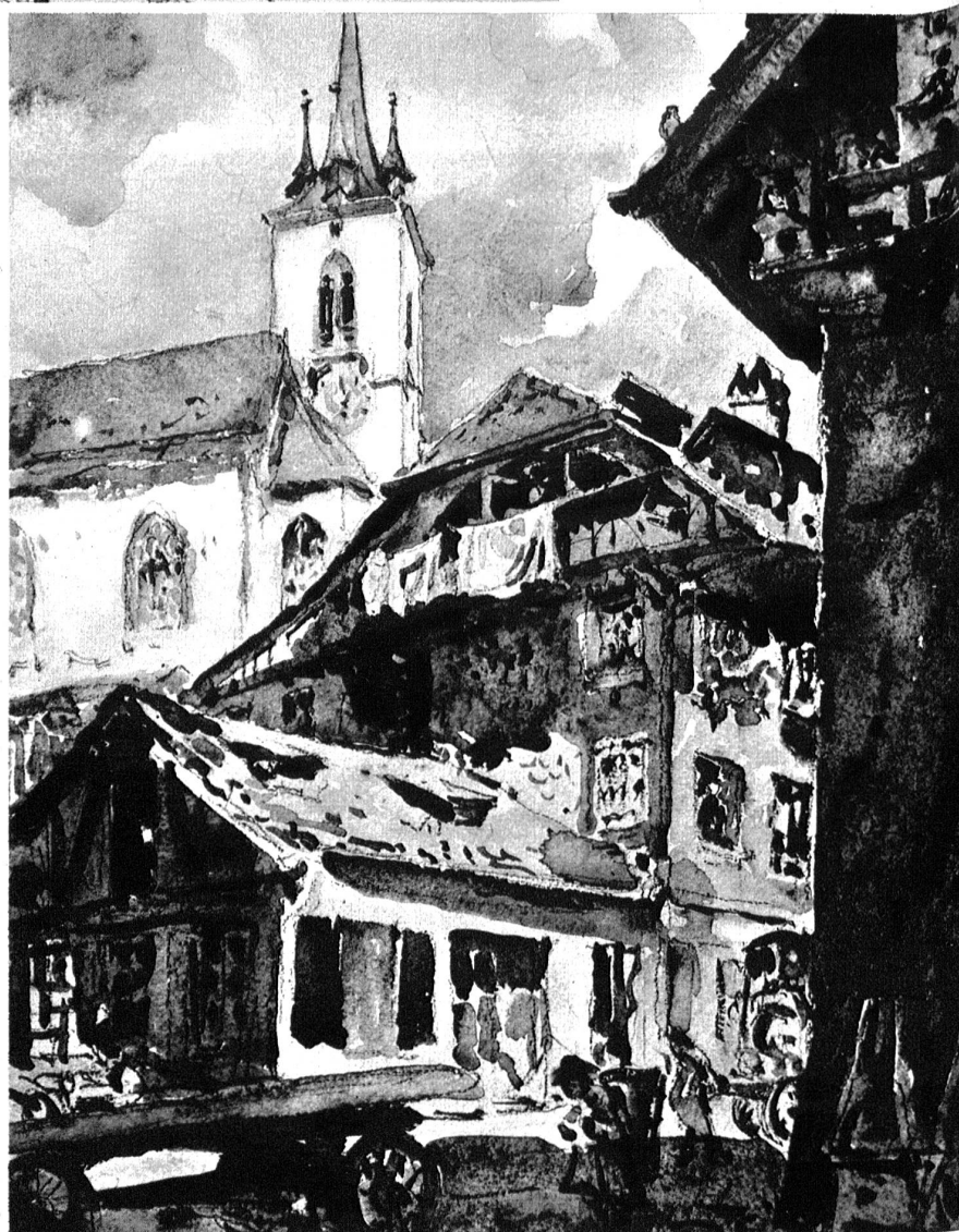
Adolf Tièche. Taubenschlag unter der Nydeckbrücke.