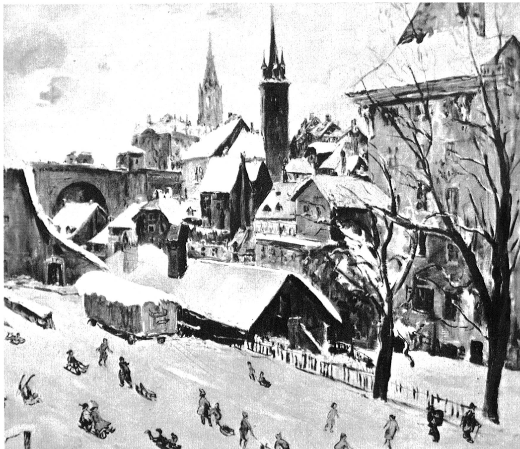
Adolf Tièche. Winterfreuden am Klösterlistutz.