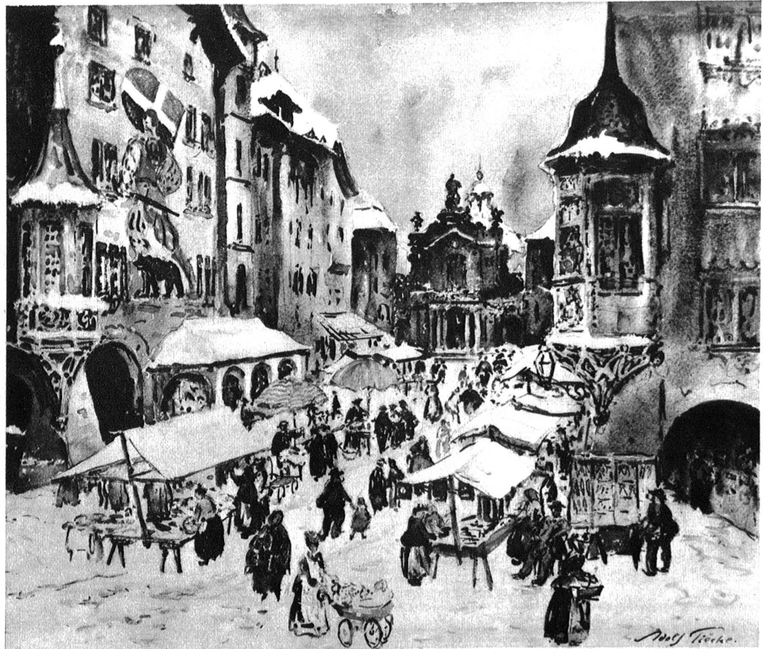
Adolf Tüèche. Markt an der Hotelgasse (1906).