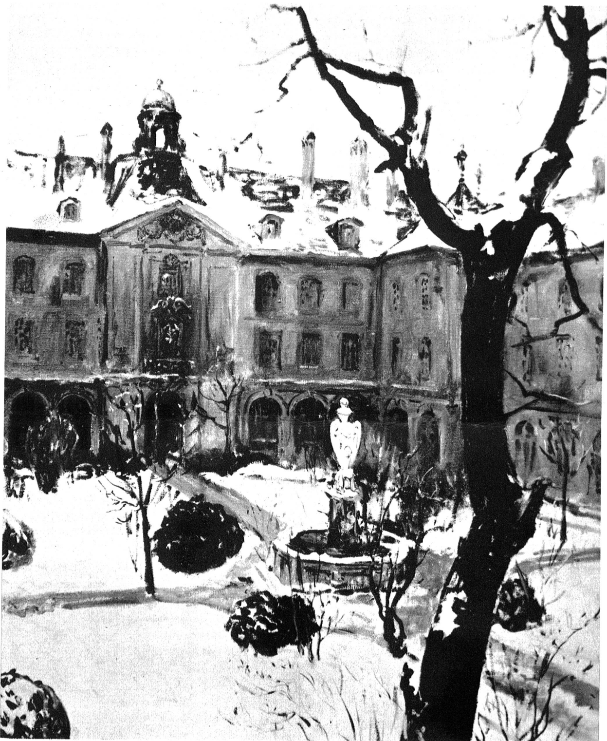
Adolf Tièche, Winter im Hofe des Burgerspitals.

Adolf Tièche, der Verkünder der Schönheiten Berns