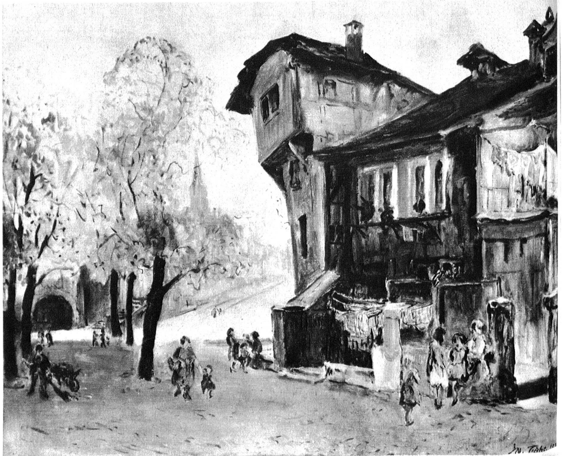
Adolf Tièche. Herbst im Nydeckhöfli.