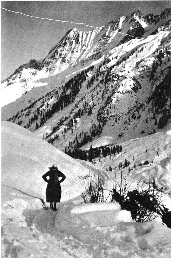
Lötschen. Am Weg nach Kühmatt.