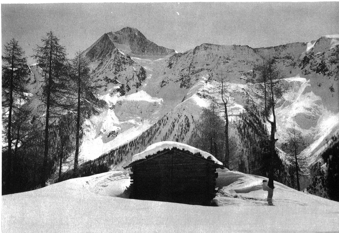
Ob Kippel, Bietschhorn.