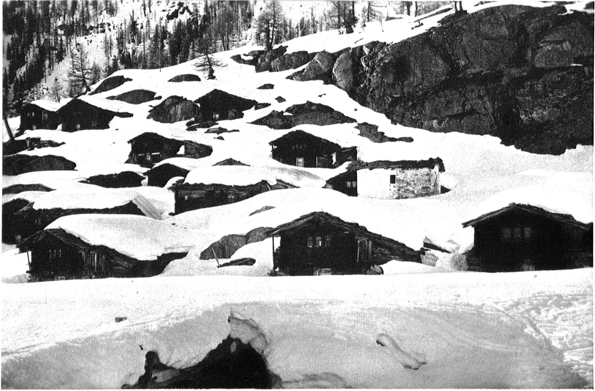
Gletscheralp im Lötschental. Die Ställe und Häuser sind mit den Felsen wie verwachsen.