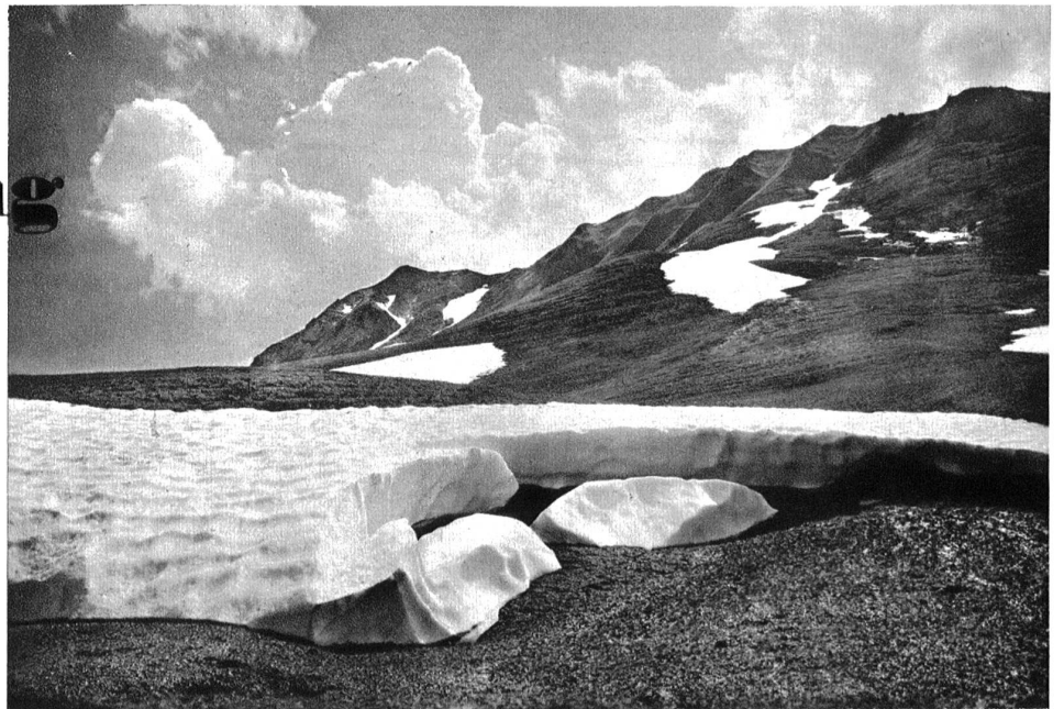
Adelboden, Schneeschmelze im Schalmi am Hahnenmoospass. Die wellige Oberfläche des Schnees zeigt die typischen Spuren der Föhnwindwirkung.