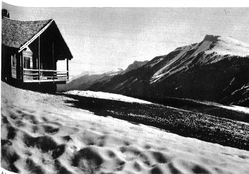
Adelboden: Tschentenalp im Frühling, Elsighorn.