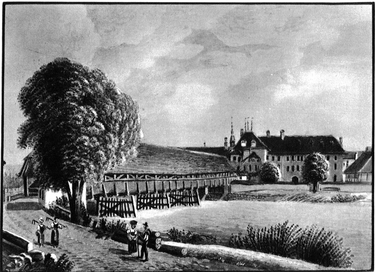
Die Brücke von Wangen mit Blick auf das Schloss, nach einem Kupferstich von S. Weibel um 1820.