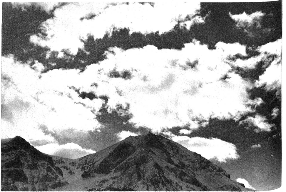
Föhnstimmung über Adelboden.