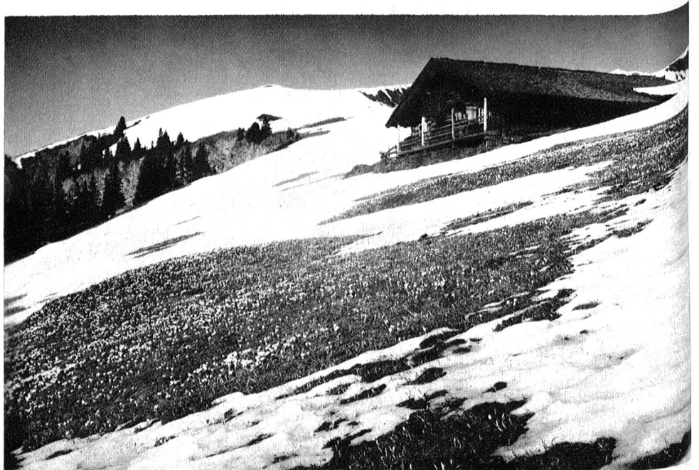
Adelboden, Schwandfelspitz.