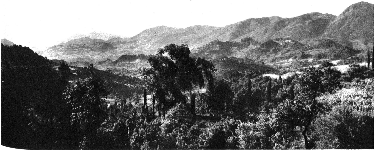
Morgenlicht in Triphylien (Nordwest-Peloponnes).

hatte meinen Erwartungen entsprochen, doch anders, als meine Phantasie sie sich ausgemalt, war die arkadische Landschaft — und ganz anders sollte die Erscheinung der Schäferin sein: