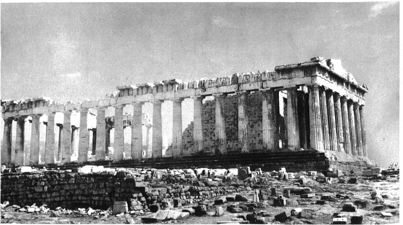
Der Parthenon. Die vor einigen Jahren wieder aufgerichtete Nordkolonnade.

des Zischen oder einen raschen Griff nach einem Stein leicht zu erwehren vermocht, aber hier waren es ihrer viere, die sich gegenseitig Mut anbellten und mir bedenklich näherückten, auch über die Ein-Meter-Grenze heran, die sie gewöhnlich innezuhalten pflegen. Schon griff ich nach meinem Photostativ, meiner einzigen Waffe —, da stürzte es oben durchs Gebüsch, ein Riesenweib, wie eine Nymade mit aufgelösten Flechten und fliegendem Gewande, barhäuptig und barfuß, sie warf, wie sie meiner ansichtig wurde, beide Arme in die Höhe und schrie gellend, wie ich noch nie jemanden habe schreien hören. Dann bückte sie sich mitten im Laufe, faßte zwei, drei faustgroße, spitze Steine und schleuderte sie mit voller Wucht den aufheulenden Bestien klatschend auf die Bäuche und segte in kürzester Zeit den Weg von dem Viehzeug rein. Es war wie ein Bild längstvergangener Zeiten, ein wilder Tanz des Urmenschen gegen die bösen Gewalten, ich stand staunend, erschüttert wie vor einem Ausbruch der Natur. „Sie hätten dich gefressen, mein Sohn“, sagte sie dann, „gefressen hätten sie dich“, und blickte mich, noch immer tiefatmend, besorgt an. „Kommen noch mehrere?“ „Nein, ich bin allein.“ „Gut denn, so gehe mit Gott.“ Und langsam schritt sie bergan, ihrer Reishütte zu, und hie und da löste sich ein Stein unter ihren braungebrannten Füßen und rollte bis auf den Weg hinab.