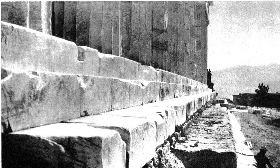
Parthenon. Die drei Marmorstufen über dem hohen Südfundament. Kaum sichtbar und doch so wirksam ist die schwache Krümmung aller Linien.