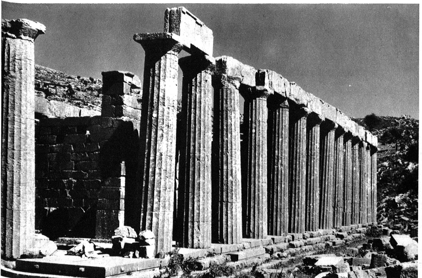
Eine stolze Reihe, wenn auch einige durch Erdbeben schief stehen. Der dorische Säulenumgang des Apollotempels von Bassae.