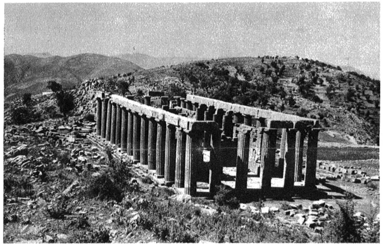
Der graue Tempel von Bassae in seiner grossartigen Einsamkeit.

Als der Jäger Aktäon die Göttin Diana beim Bade belauschte, erzürnte sie, beßte seine eigenen Hunde gegen ihn, den sie in einen Hirsch verwandelte, und sie zerrissen ihn. Ich hatte keine Gelegenheit, Diana zu belauschen, dafür wurde ich auch nicht zerrissen, aber ein Hundeabenteuer, das zu jeder Peloponnesfahrt gehört, hatte ich doch, als ich den Rückweg vom windumspieltten, grauen Tempel des Apollo antrat. Unten im Tale rasten sie um die Ecke des Weges, zuerst einer, weiß, groß wie ein Kalb, aber nicht eben der Kühnste, dafür bellte er kräftig und holte so seine Kumpane herbei. Unten keuchte einer herauf, oben schossen zwei durchs Dickicht herunter, geifernd, mit abgedeckten Zähnen und borstig hochgesträubtem Nackenhaar. Ein furchterregendes Schauspiel! Bisher hatte ich mich einzelner Hunde nach Art der Griechen durch ein drohen-