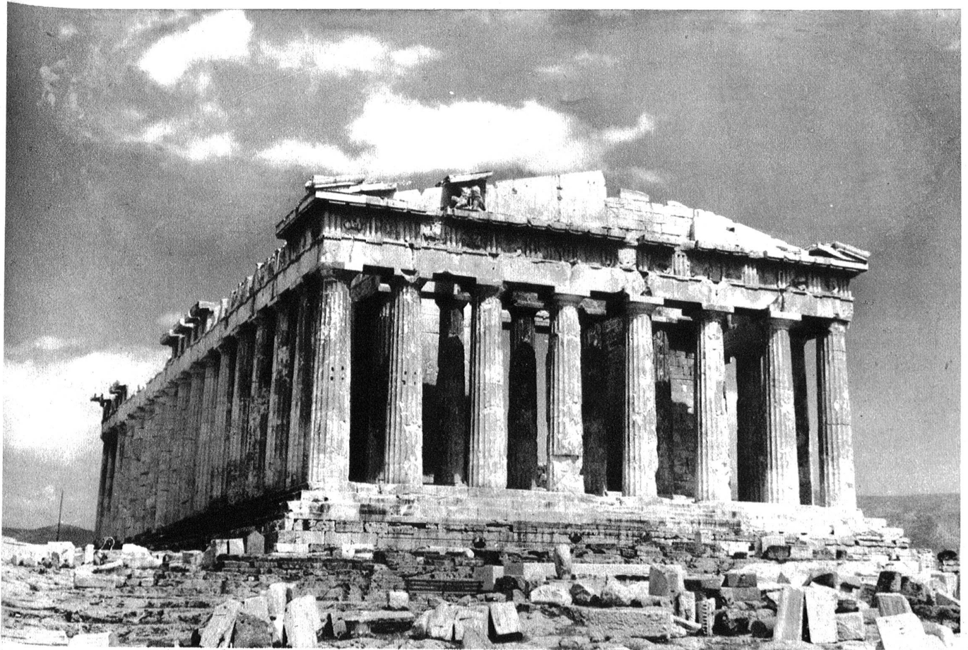
Athen, Akropolis. Der Parthenon von Westen. Es ist die Rückseite des Gebäudes, die der antike und der moderne Besucher zuerst sah.