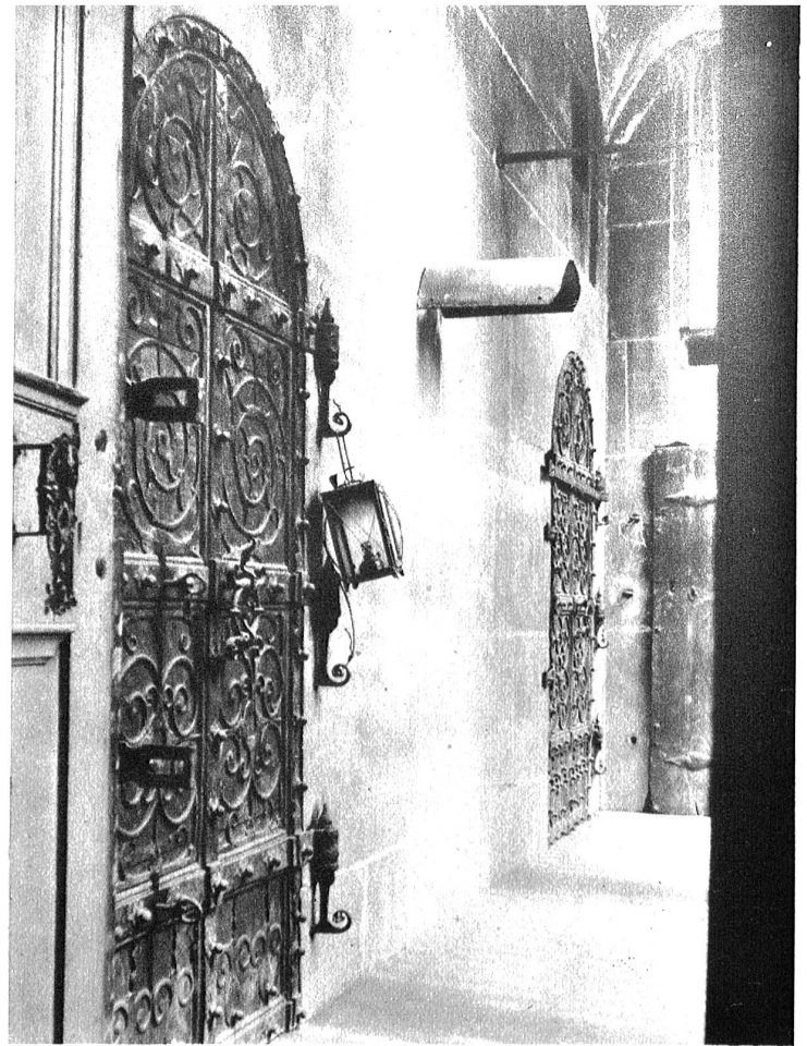
Die beiden kunstvollen, schweren Eisentüren, die zur ehemaligen Schatzkammer führten. Sie behüteten den fast sagenhaft berühmten alten bernischen Staatsschatz, dessen Bestand an Gold und Silber man noch heute nicht genau kennt, da darüber keine Rechnung geführt wurde. Er wurde 1798 von den Franzosen geplündert, nach der von der französischen Regierung im Jahre 1792 aufgestellten Staatsmaxime: „Frankreich ist nicht reich genug, um Europa gratis zu befreien; es hat daher ein Recht, zu seiner Schadloshaltung bei den befreiten Völkern auf alles Staats-, Kirchen- und Aristokratengut die Hand zu legen.“