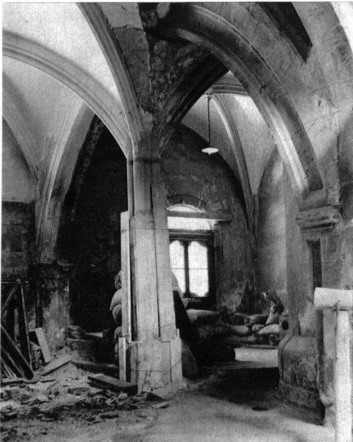
Ein Kreuzgewölbe im Innern des Gebäudes.