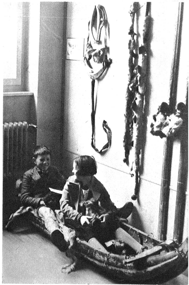
Zwei Berner Schulkinder sitzen im Lappenschlitten.