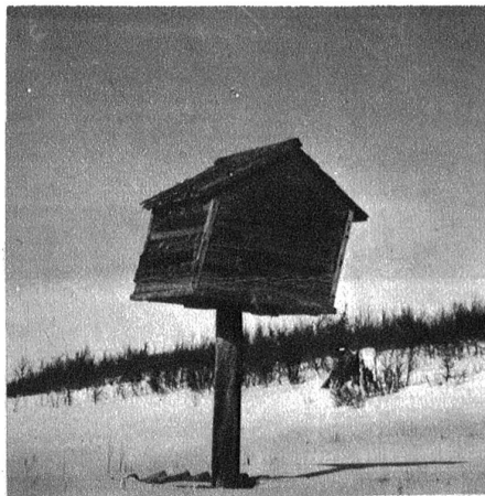
Gegen wilde Tiere sind die Vorratshäuser der Lappen auf einem hohen Pfahl gesichert.