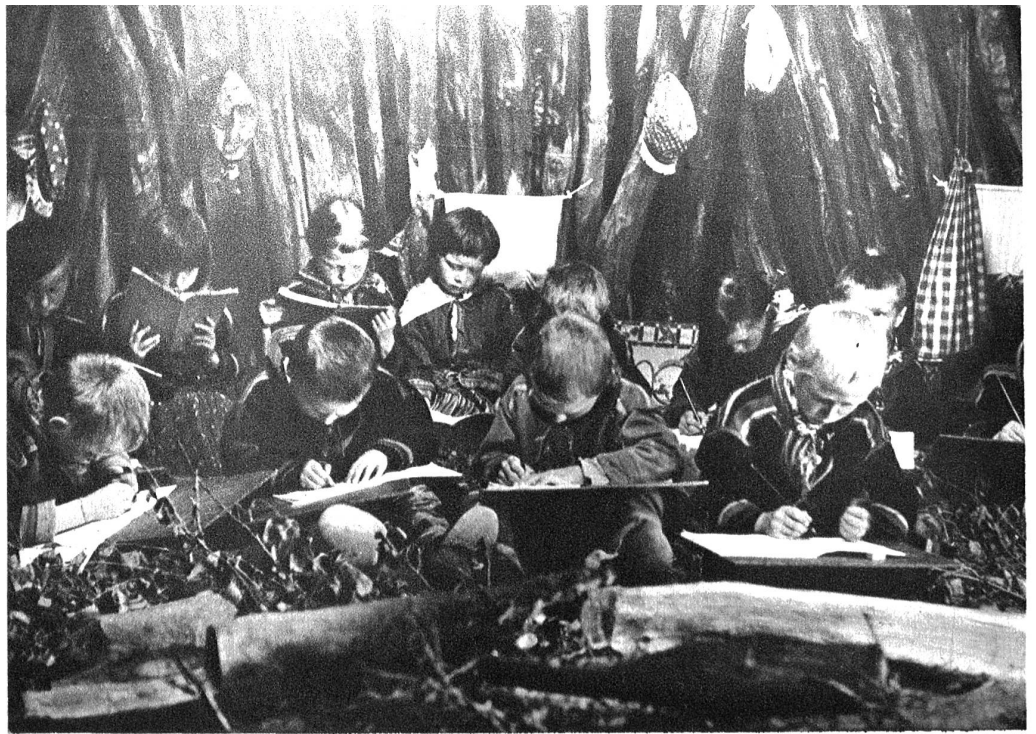
Die Sommerschule in der Lappenhütte, der sogenannten Kota. Lerneifrig über ihre Schreibbretter gebeugt, sitzen die Kinder um das offene Feuer auf dem Reisigboden.