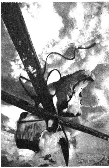
Der Lappenski mit den dazugehörigen Fell-Skischuhen.