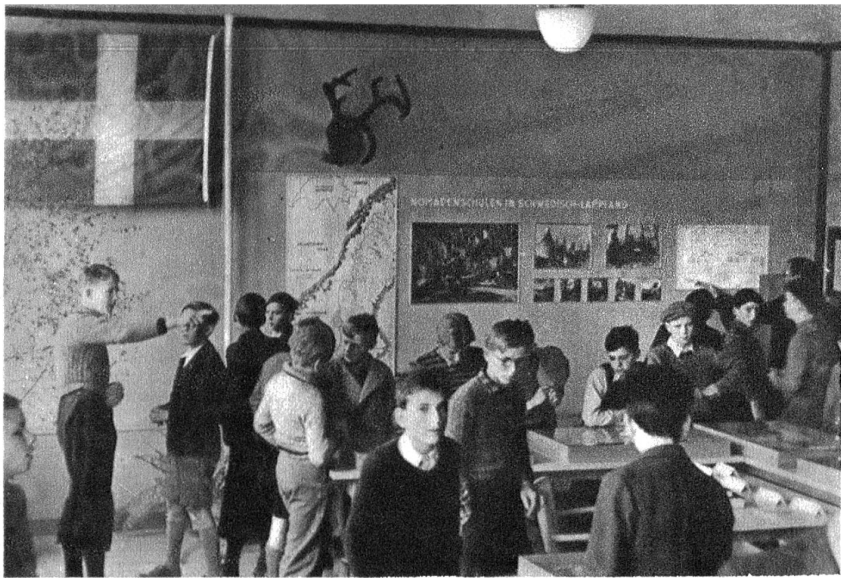
Blick in die Ausstellung. Links die Finnische Fahne.