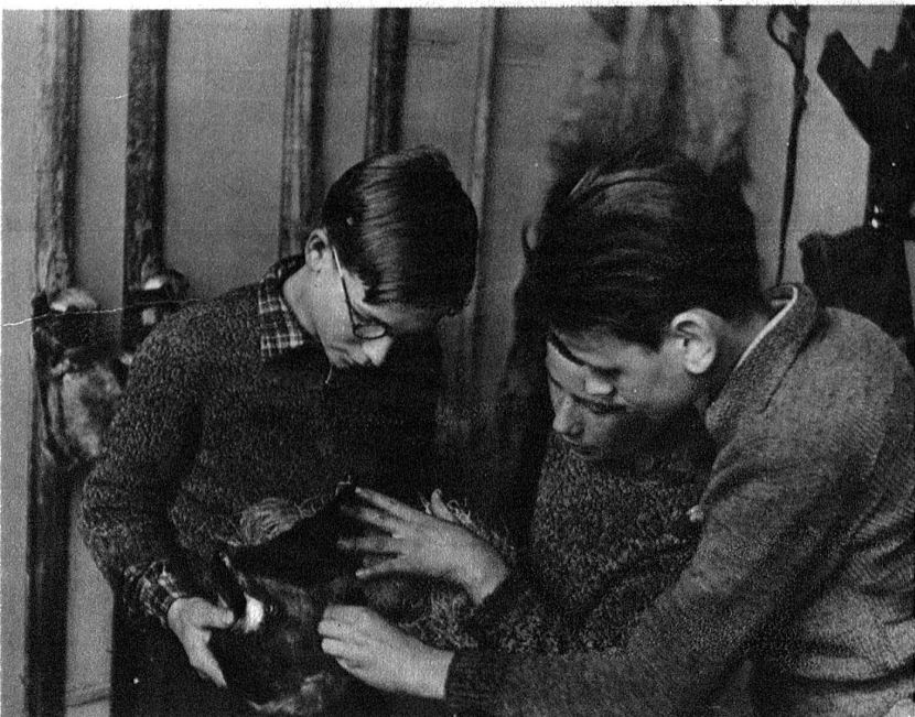
Der Fell-Skischuh. Statt Socken trockenes Gras.