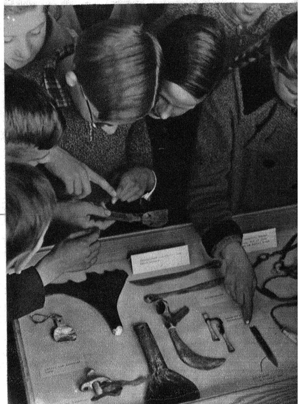
Und das Schönste — man darf alles berühren! Die Schulkinder besichtigen von Hand die Werkzeuge und Geräte der Lappen.