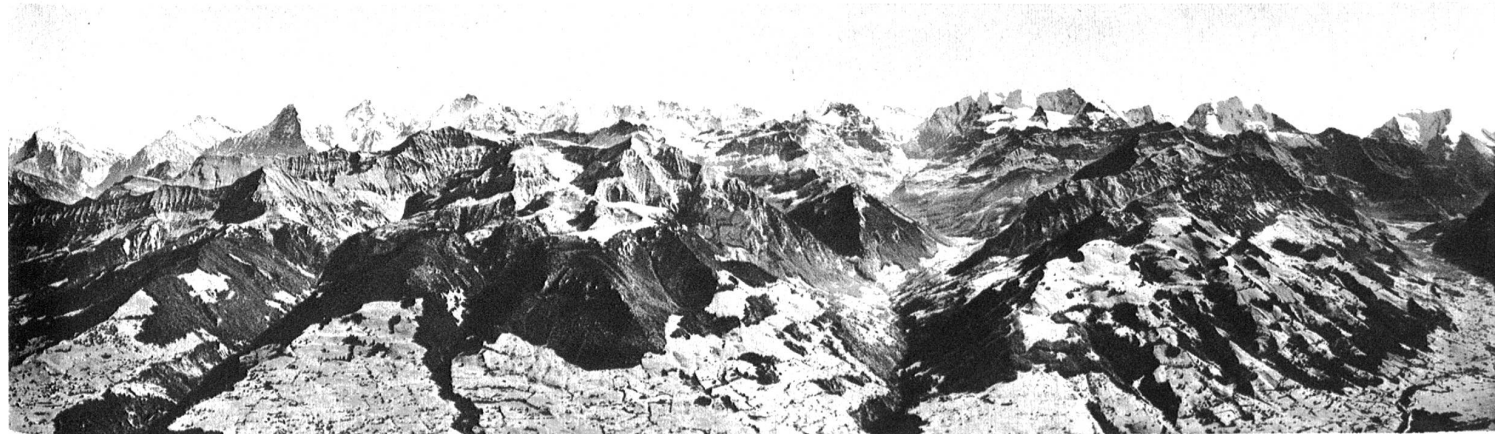
Panorama vom Niesen aus: Vom Wetterhorn bis Altels.