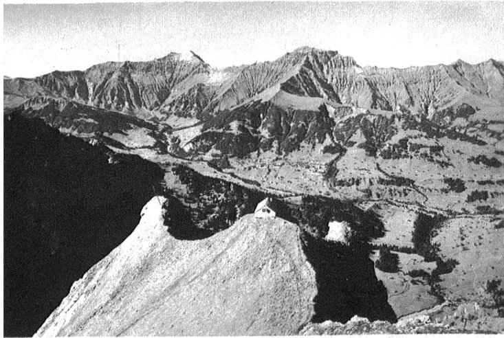
Albristhorn und Gsür