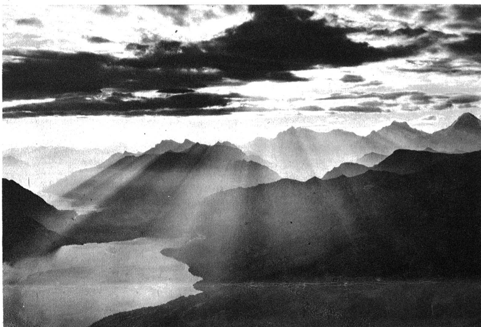
Wolkenstimmung. Blick auf den Thuner- und Brienzensee.