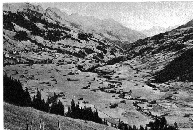
Niesenrange vom Linterhorn-Niesen. Im Vordergrund das Tal von Adelboden.