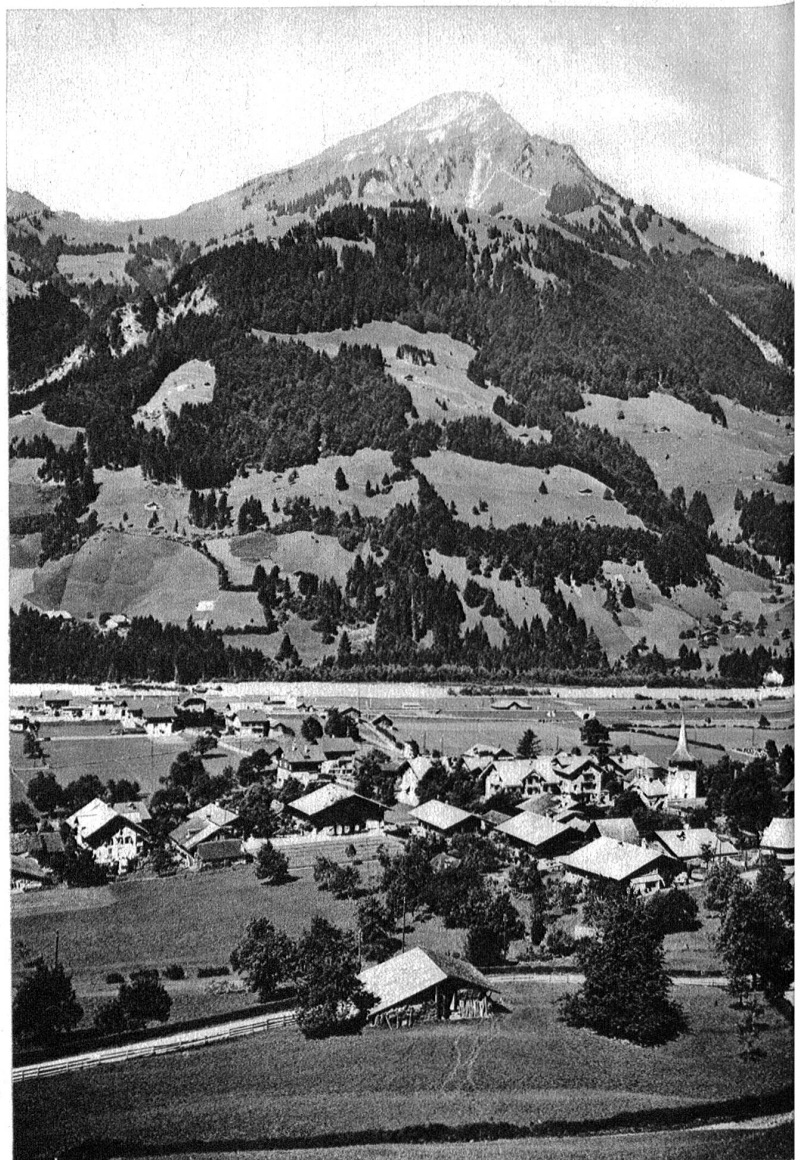
Niesen von Reichenbach aus.