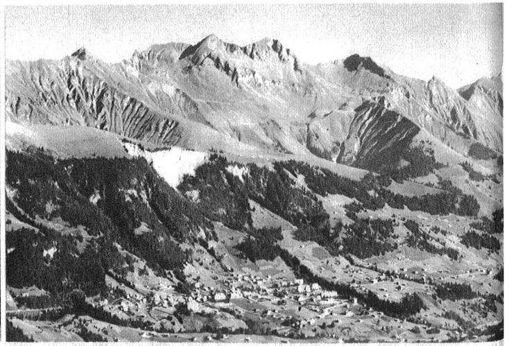
Wannenspitz-Weissenfluh oder Dreimännler-Männliflüh-Winterhorn-Ladholzhorn-Linterhorn-Weissefluh.