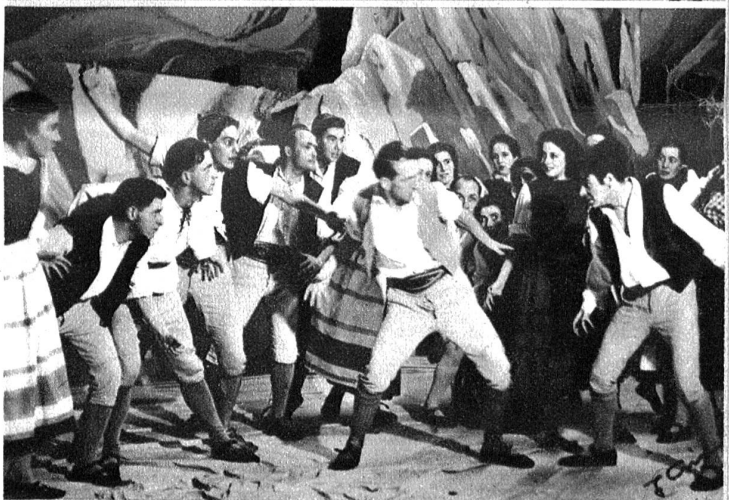
Aus der Tanzpantomime „Das Dorf unter dem Gletscher“ von Heinrich Sutermeister und Albert Rösler.