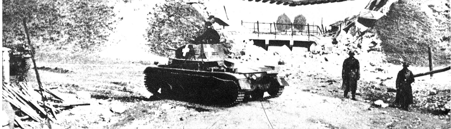
Obenstehendes Bild: Ein deutscher Tank im Angriff. Was an ihm ins Auge fällt ist das Kreuz, das unserem schweizerischen Hoheitszeichen ähnlich sieht. Es ist nicht genau bekannt, ob die Farbe dieses Zeichens weiss sei; jedenfalls fehlt aber der rote Grund. Das Kreuz ist direkt auf der Grundfarbe des Panzerwagens aufgemalt und dient als Erkennungszeichen. Auch die englische und französische Tankwaffe hat dergleichen Zeichen, die eine Beschiessung durch eigene Truppen verhindern sollen.